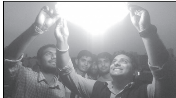
એટલા માટે ગુજરાતભરમાં આ દિવસને ઉતરાયણ તરીકે જ્યારે આ વર્ષે અરવલ્લી જિલ્લામાં

ઓછા પવનને લઈને પતંગ ચલાવનાર પતંગ રસિયાઓની ઉતરાણ ફીકી રહી હતી. જોકે વહેલી સવારથી જ લોકો ધાબા ઉપર ચડી ગયા હતા અને એ કાપ્યો... લપેટ લપેટની ભુમો પાડતા હતા. જ્યારે સાંજે લોકોએ ચાઈનીઝ બહુન ડાવીને આ પર્વની મજા ભુટ્ટી હતી. જ્યારે ચાઈનીઝ બહુનને