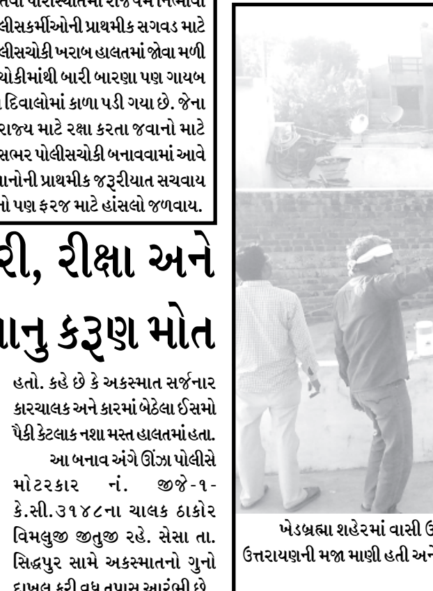
ખેડબ્રહ્મા શહેરમાં વાસી ઉત્તરાયણ યોગ્ય પવન રહેતા પતંગ રસિયાઓએ પતંગ ઉડાવી પેચ લડાવી ઉત્તરાયણની મજા માણી હતી અને સાથો-સાથ ઉંધીયા જલેબીની લીજજત પણ માણી હતી.

પાલનપુર, તા. ૧૫ બનાસકાંઠા જિલ્લામાંથી દારૂની બદી સદંતર નેસ્ટ નાબૂદ કરવા બનાસકાંઠા જિલ્લા પોલીસ અધિક્ષકશ્રી ડી.બી.વાઘેલાની સુચના અને માર્ગદર્શન અનુસાર પોલીસ ઈન્સપેક્ટરશ્રી એ.વ.સી.બી., એસ.ઓ.જી, પેરોલ ફ્લો અને એન્ટી રોમીયો સ્કોર્ડ પાલનપુર સદન કામગીરી કરી રહ્યા છે. જિલ્લાના પોલીસ સ્ટેશનોના વિસ્તારોમાં પર-નિતિય ઈંગ્લીશ દારૂનો ધંધો કરતા ઈસમો તેમજ રાજસ્થાન રાજ્યમાંથી હેરાફેરી કરતા ઈસમો વિરુદ્ધ કાયદેસરની કાર્યવાહી કરી વડગામ, ડીસા તાલુકા, આગથળા, અંબાજી, ધાનેરા, છાપી, થરાદ પોલીસ સ્ટેશનના વિસ્તારમાંથી પર-નિતિય ઈંગ્લીશ દારૂના ૯ કેસો શોધી કાઢવામાં આવ્યા છે. અને આ ગુનાઓમાં સંડોવાયેલા ઈસમો વિરુદ્ધ હદપાર/પાસા જેવા અટકાતી પગલાં લેવાનો નિર્ણય લેવામાં આવ્યો છે.