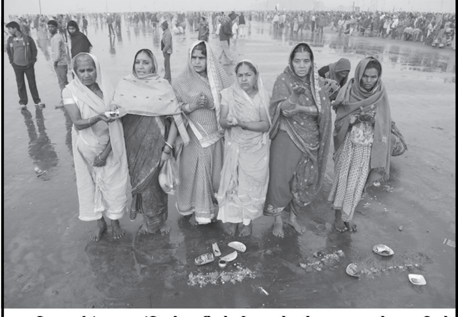
હિન્દુ ધર્મમાં મકરસંક્રાંતિ એ સૂર્યદેવને રીંગવવાનો તહેવાર ગણાય છે. આ દિવસે શ્રદ્ધાળુઓ ગંગા સાગરમાં ડુબકી લગાવી સૂર્યદેવતાને અર્ચન સમર્પિત કરે છે. આ શ્રદ્ધાળુઓ પગપાળા ચાલીને ગંગા સાગર તટે પહોંચ્યા હતા અને સૂર્યદેવની પૂજા અર્ચના કરી હતી.

મુંબઈ, તા. ૧૫ દેશમાં ઈન્ટરનેટનો ઉપયોગ કરનારની સંખ્યામાં રેકોર્ડ ગતિએ વધારો થઈ રહ્યો છે. આગામી દિવસોમાં તેમાં વધુ વધારો થઈ શકે છે. તાજેતરમાં કરવામાં આવેલા સર્વે એજન્ટ ગુગલના એક અભ્યાસમાં દાવો કરવામાં આવ્યો છે કે દેશના ૧૫ કરોડ ઈન્ટરનેટ અભ્યાસકારોમાં આશરે ૫૦ ટકા મહિલાઓ છે. તેમાંથી આશરે ૨.૪ કરોડ મહિલાઓ ઈમેઈલ ચકાસણી, સોશિયલ નેટવર્કિંગ સાઈટ ઉપર વાતચીત કરવા અને ઓનલાઈન શોપિંગ કરવા માટે દરરોજ કોમ્પ્યુટર લોગઓન કરે છે. ૨.૪ કરોડ મહિલાઓ દરરોજ લોગઓન કરે છે તેવી માહિતી આવા બાદ એક બાબત ઊભરીને સામે આવી છે કે સોશિયલ નેટવર્કિંગ સાઈટોની બોલબાલા વધી રહી છે. ગુગલ ઈન્ડિયાના નાયબ અધ્યક્ષ અને અધિકારી રાજન આનંદને કહ્યું છે કે ભારતમાં આશરે ૭ કરોડ મહિલાઓ હવે ઓનલાઈન છે અને પોતાની દરરોજની લાઈફને વધુ વ્યવસ્થિત કરવા માટે ઈન્ટરનેટનો ઉપયોગ કરે છે. ઘર, સાઈબર ક્રાઈમ, ઓફિસ અને સ્માર્ટ ફોનના વધતા પ્રવાહના પરિણામ સ્વરૂપે ઈન્ટરનેટ સુધી સરળ પહોંચવાનો તરીકો બની ગયો છે. મહિલાઓ દ્વારા ઈન્ટરનેટનો ઉપયોગ જુદા જુદા કામો માટે કરવામાં આવે છે. અભ્યાસમાં એમ પણ જણાવવામાં આવ્યું છે કે ઓનલાઈન થવાની મહિલાઓ અપેક્ષાની સરખામણીમાં વધારે સમૃદ્ધ અને યુવા છે. ઓનલાઈન ગતિવિધિઓની યાદીમાં ઈમેઈલ સર્વે અને સોશિયલ નેટવર્કિંગ છે.