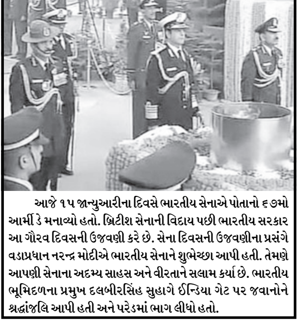
આજે ૧૫ જાન્યુઆરીના દિવસે ભારતીય સેનાએ પોતાનો ૬૭મો આર્મી ૩ મનાવ્યો હતો. બ્રિટીશ સેનાની વિદાય પછી ભારતીય સરકાર આ ગૌરવ દિવસની ઉજવણી કરે છે. સેના દિવસની ઉજવણીના પ્રસંગે વડાપ્રધાન નરેન્દ્ર મોદીએ ભારતીય સેનાને શુભેચ્છા આપી હતી. તેમણે આપણી સેનાના અદ્યત્ન સાહસ અને વીરતાને સલામ કર્યા છે. ભારતીય ભૂમિદળના પ્રમુખ દલબીરસિંહ સુહાગે ઈન્ડિયા ગેટ પર જવાનોને શ્રદ્ધાંજલિ આપી હતી અને પરેડમાં ભાગ લીધો હતો.