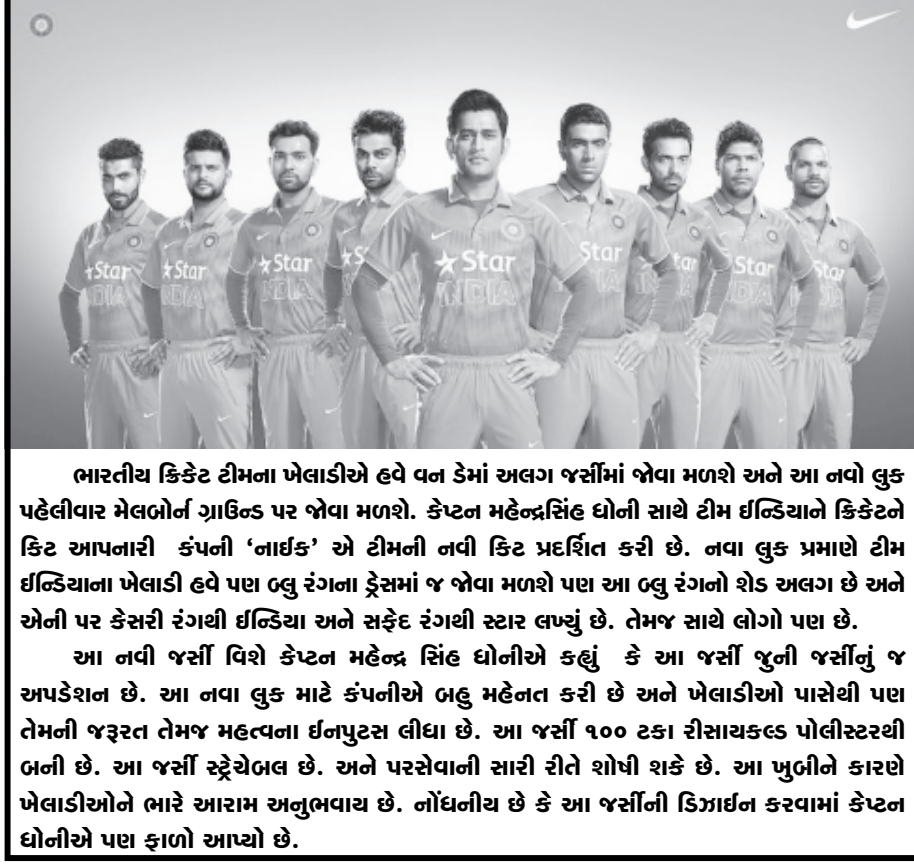
ભારતીય ક્રિકેટ ટીમના ખેલાડીએ હવે વન ડેમાં અલગ જર્સીમાં જોવા મળશે અને આ નવો લુક પહેલીવાર મેલબોર્ન ગ્રાઉન્ડ પર જોવા મળશે. કેપ્ટન મહેન્દ્રસિંહ ધોની સાથે ટીમ ઈન્ડિયાને ક્રિકેટને કિટ આપનારી કંપની 'નાઈક' એ ટીમની નવી કિટ પ્રદર્શિત કરી છે. નવા લુક પ્રમાણે ટીમ ઈન્ડિયાના ખેલાડી હવે પણ ઓલુ રંગના ડ્રેસમાં જ જોવા મળશે પણ આ ઓલુ રંગનો શેડ અલગ છે અને એની પર કેસરી રંગથી ઈન્ડિયા અને સફેદ રંગથી સ્ટાર લખ્યું છે. તેમજ સાથે જોયું પણ છે. આ નવી જર્સી વિશે કેપ્ટન મહેન્દ્ર સિંહ ધોનીએ કહ્યું કે આ જર્સી જુની જર્સીનું જ અપડેશન છે. આ નવા લુક માટે કંપનીએ બહુ મહેનત કરી છે અને ખેલાડીઓ પાસેથી પણ તેમની જરૂરત તેમજ મહેત્વના ઈનપુટસ લીધા છે. આ જર્સી ૧૦૦ ટકા રીસાયકલ પોલીસ્ટરથી બની છે. આ જર્સી સ્ટ્રેચેબલ છે. અને પરસેવાની સારી રીતે શોષી શકે છે. આ ખુબીને કારણે ખેલાડીઓને ભારે આરામ અનુભવાય છે. નોંધનીય છે કે આ જર્સીની ડિઝાઇન કરવામાં કેપ્ટન ધોનીએ પણ ફાળો આપ્યો છે.

મુંબઈ, તા. ૧૫ આમીરખાનની ફિલ્મ પીકે બોક્સ ઓફિસ પર એકપછી એક રેકોર્ડ તોડી રહી છે. હવે તેની કમાણી ૬૦૦ કરોડથી પણ વધારે થઈ ગઈ છે. આ ફિલ્મ બોલિવુડની સૌથી સફળ ફિલ્મ બની ગઈ છે. શાહરૂખ અને સલમાનની સરખામણીમાં તેની ફિલ્મો વધારે કારોબાર કરી રહી છે. જે સાબિત કરે છે કે આમીરખાન સૌથી લોકપ્રિય છે. ત્રણેય પાન કરતા આમીરની ફિલ્મો વધારે કમાણી કરી રહી છે. ટિકિટ બારી પર પ્રભુત્વ રહ્યું છે. ભારતમાં ફિલ્મની કમાણી ૪૫૧ કરોડ સુધી પહોંચી ગઈ છે. જ્યારે વિદેશમાં ૧૫૧ કરોડનો કારોબાર કરી ચુકી છે જેથી કુલ કમાણી ૬૦૧ કરોડ થઈ છે. આ ફિલ્મ ભારતમાં સિનેમાંમાં હજુ ચાલી રહી છે. રાજકુમાર હિરાની દ્વારા નિર્દેશિત ફિલ્મ પીકે વિદુ વિનોદ ચોપડા દ્વારા બનાવવામાં આવી છે. જેમાં આમીરખાન, સંજયદત્ત અને અનુષ્કા શર્મા અને સુશીલા સિંહ રાજપુત ભૂમિકા અદા કરી છે. ફિલ્મમાંમાં આમીરખાન પીકે તરીકે છે. આ ફિલ્મનું શુટિંગ સત્તાવાર રીતે પહેલી ફેબ્રુઆરી ૨૦૧૩ના દિવસે શરૂ કરવામાં આવ્યું હતું. સૌથી પહેલા ૨૬ દિવસ માટે શુટિંગ દિલ્હીમાં રહી ફિલ્મની જરદાર રજૂઆત શરૂ કરવામાં આવ્યા બાદ તેમાં તેજ આવી હતી. ફિલ્મ સાથે સંબંધિત પ્રથમ પોસ્ટર ૩૧મી જુલાઈ ૨૦૧૪ના દિવસે જારી કરવામાં આવ્યું હતું. આમીરખાન પોસ્ટરમાં ન્યુડ રહેતા ભારે વિવાદ થયો હતો. મુંબઈ ખાતે આયોજિત કાર્યક્રમમાં ૨૦મી ઓગષ્ટ ૨૦૧૪ના દિવસે અન્ય પોસ્ટર જારી કરતા ઉત્સુકતા રહી હતી. ત્રીજા પોસ્ટરમાં સંજયદત્ત ભેરવસિંહ તરીકે રજૂ કરતા તેની ચર્ચા રહી હતી. ચોથા પોસ્ટરમાં આમીર અને અનુષ્કા હતા. જે પોસ્ટર ૧૬ ઓક્ટોબર ૨૦૧૪ના દિવસે લોન્ચ કરવામાં આવ્યા બાદ તેની ચર્ચા રહી હતી આ ફિલ્મની જરદાર રજૂઆત કરવામાં આવી રહી છે. ભારતમાં ૫૦૦૦ સ્ક્રીન અને વિદેશમાં ૮૨૦ સ્ક્રીનમાં આ ફિલ્મ ૧૯મી ડિસેમ્બરના દિવસે રજૂ કરાઈ હતી.