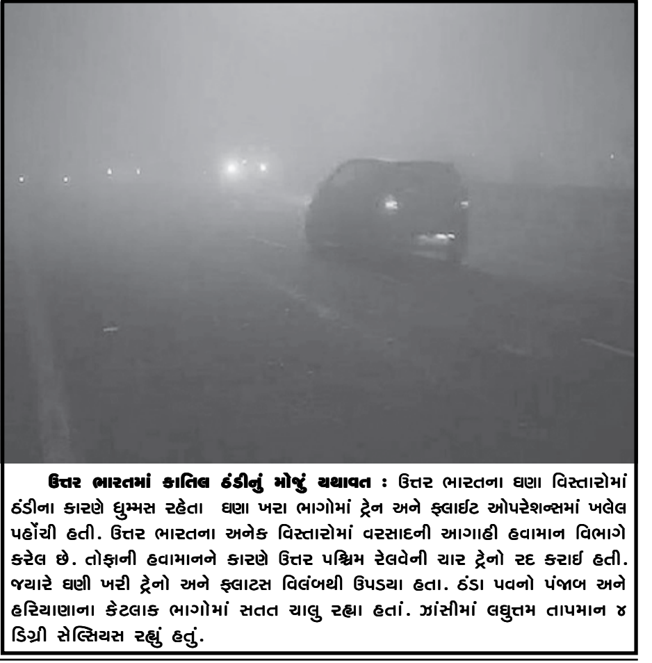
ઉત્તર ભારતમાં કાલિદ દંડીનું મોજુ ઘથાવત : ઉત્તર ભારતના ઘણા વિસ્તારોમાં દંડીના કારણે ધુમ્મસ રહેતા ઘણા ખરા ભાગોમાં ટ્રેન અને ફ્લાઈટ ઓપરેશનમાં ખલેલ પહોંચી હતી. ઉત્તર ભારતના અનેક વિસ્તારોમાં વરસાદની આગાહી હવામાન વિભાગે કરેલ છે. તોફાની હવામાનને કારણે ઉત્તર પશ્ચિમ રેલવેની ચાર ટ્રેનો રદ કરાઈ હતી. જ્યારે ઘણી ખરી ટ્રેનો અને ફ્લાઈટસ વિલંબથી ઉપડવા હતા. દંડા પવનો પંજાબ અને હરિયાણાના કેટલાક ભાગોમાં સતત ચાલુ રહ્યા હતાં. ઝાંસીમાં લઘુત્તમ તાપમાન ૪ ડિગ્રી સેલ્સિયસ રહ્યું હતું.

એફએમસીજીની મહાકાય કંપની એચયુએલમાં ૦.૪ ટકાનો ઉછળાવો જોવા મળ્યો હતો. અંતે ઉલ્લેખનીય છે કે, શેરબજારમાં ગઈકાલે સતત ત્રીજા દિવસે તેજ રહી હતી. આની સાથે જ છ સપાટીમાં સૌથી ઉંચી સપાટી જોવા મળી હતી. સોમવારે વિપ્રોમાં જોરદાર કમાણીના પરિણામ જાહેર કરાયા હતા. ગઈકાલે કારોબારના અંતે સેસેક્સ ૧૪૦ પોઈન્ટ ઉછળીને ૨૮૬૨ની સપાટીએ રહ્યો હતો. જ્યારે નિક્કટી ૩૭ પોઈન્ટ ઉછળીને ૮૫૫૧ની સપાટીએ રહ્યો હતો. વધુમાં સંસ્થાકીય રોકાણકારોએ ૧૧૦૦ કરોડની કિંમતના ભારતીય ઈકોનોમીમાં ખરીદી કરી છે. સ્ટોક એક્સચેન્જના આંકડામાં આ મુજબની વાત કરવામાં આવી છે. એશિયન બજારમાં આજે મિશ્ર સ્થિતિ રહી હતી.