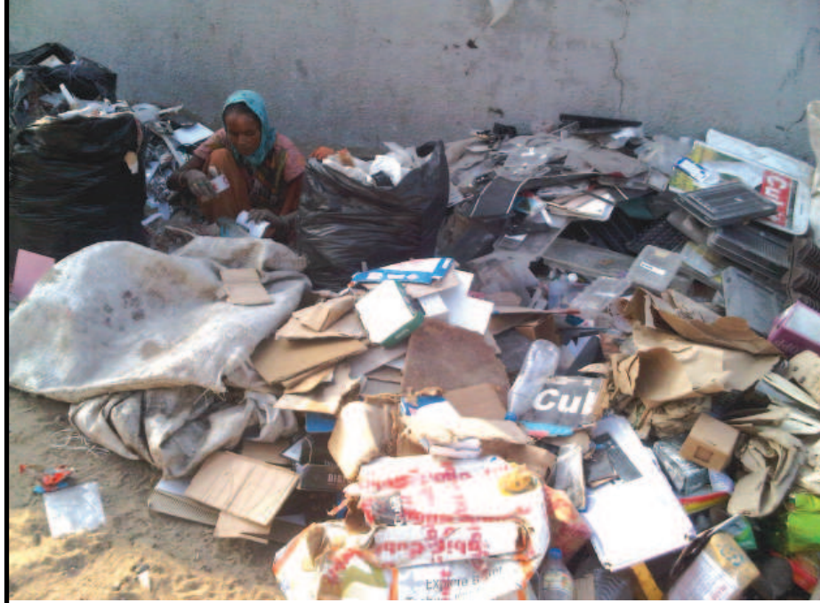
પરિશ્રમનો કોઈ વિકલ્પ નથી - અનેક મર્યાદાઓની વચ્ચે જીવનને જીવંત રાખવાની ક્ષમતા કેળવવી એ પડકારજનક છે... પરંતુ પરમતત્વએ જ્યાં પડકારો આપ્યા છે, ત્યાં જીવવા માટે શક્તિ પણ આપી છે... પિડીતો અને વંચિતો માટે વિકાસ અને કલ્યાણ જોવા શબ્દો હજુ માત્ર શબ્દો જ રહ્યા છે... ૨૪ કલાક પરિશ્રમ કરી પેટીયું રળતા શ્રમિકોની હાલત આજે પણ યથાવત છે... આ તસવીર કોઈ ગામડાની કે કોઈ કર્મચાની નથી, તસવીર ગાંધીનગર જેવા નવા નકકોર નગરની છે... અહીં પણ ગરીબી હજુ પણ એની એ જ હાલતમાં કચરાની વચ્ચે કપાસે છે... વિકાસની વાત કરવી એ એક વાત છે અને વિકાસના ફળ છેવાડાના માણસો સુધી પહોંચાડવા એ બીજી વાત છે... જોકે આ અસમંજસતા વર્ષોથી ચાલી છે અને વર્ષો સુધી ચાલશે એમ લાગે છે...

સ્વર્ણિમ પાર્કની દુકાનો ભાડા પેટે ફાળવવા બે મહીના અગાઉ ટેન્ડર પ્રક્રિયા હાથ ધરાઈ હતી : તળાવની દુકાનો પણ બંધ હાલતમાં મે મહીનાથી ટેન્ડર આપરી ન થતા મામલો અટવાયો છે. શહેરના હાર્દસમા વિસ્તારમાં સ્વર્ણિમ પાર્કના ગ્રીમ પ્રોજેક્ટનું કામ પૂર્ણ થતા આગામી દિવસોમાં સહેલાણીઓ માટે આ હોટ ફેવરીટ પોઈન્ટ બનશે. સ્વર્ણિમ પાર્કમાં વિહરતા સહેલાણીઓને ફૂડકોર્ટની સુવિધા ઉપલબ્ધ થાય તે માટે પાર્કની બંને સાઈડ ૧૦ જેટલી દુકાનો પણ બાંધવામાં આવી છે. જ્યારે આ દુકાનો ભાડા પેટે ફાળવવાનો નિર્ણય લેવાયા બાદ તંત્ર કક્ષાએથી ટેન્ડર પ્રક્રિયા પણ હાથ ધરવામાં આવી હતી. આ ઉપરાંત સે-૧ ના નવવિકસિત તળાવને અનુલક્ષીને પણ ફૂડકોર્ટ તૈયાર કરી દેવાઈ છે. આ દુકાનો પણ પાણી-પીણીના સ્ટોલ તરીકે ઉપયોગમાં લેવાય તે માટે ભાડા પેટે ફાળવવાનો નિર્ણય લેવાયો હતો. આ બંને સાઈડ પર ફૂડકોર્ટ ધમધમતી થાય તે માટે દુકાનો ધમધમતી કરવા અગાઉ તંત્ર દ્વારા ટેન્ડર પ્રક્રિયા હાથ ધરવામાં આવી હતી. સ્વર્ણિમ પાર્ક તેમજ સે-૧ની દુકાનો ભાડેથી ફાળવવા બે મહીના અગાઉ પ્રક્રિયા હાથ ધરવામાં આવી હતી પરંતુ બે મહીનાના અંતે પણ ટેન્ડર આપરી ન થતા ફૂડકોર્ટનું ઠેકાણું પડ્યું નથી તળાવ અને સ્વર્ણિમ પાર્કના વિસ્તારમાં આવતા સહેલાણીઓએ પણ હાલાકી ભોગવવી પડે છે.