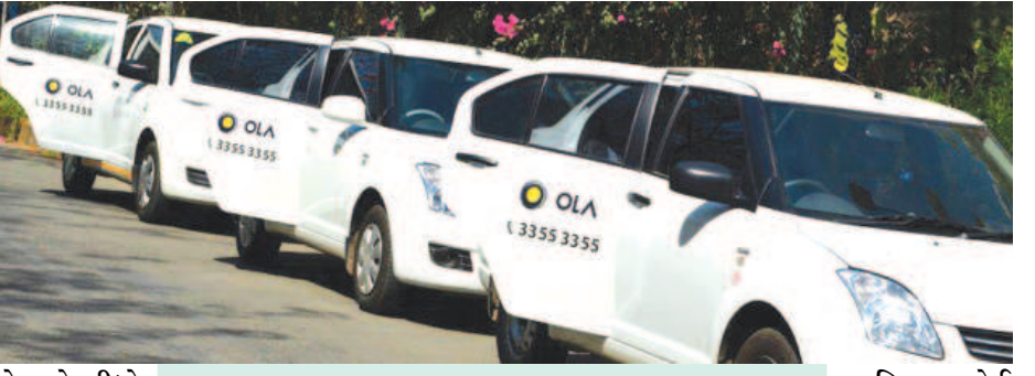
ગુજરાતના શહેરોમાં પણ ટુંક જ સમયમાં ટેક્સીઓ દોડતી જોવા મળશે. રાજ્ય સરકારે આ અંગેની મંજૂરી આપી દીધી છે. જેનો પાર્શ્વત્ર પ્રોજેક્ટ અમદાવાદમાં હાથ ધરાશે. જ્યારે ટેક્સી સર્વિસ રીક્ષાઓની માફક જ લોકોને એક સારો વિકલ્પ આપશે તેવું મનાઈ રહ્યું છે. દરમિયાન કોઈ ઈમરજન્સી અથવા શિયાળો ચોમાસુ કે ઉનાળામાં ઠરતા-પલળતા કે ગરમીથી બચીને જવાનું હોય તે સ્થળે સરતી સેવા મેળવી શકી છે. જ્યારે વૃદ્ધ કે બિમાર વ્યક્તિઓ પણ જરૂરીયાત મુજબ લાભ લઈ રહ્યા છે. ગાંધીનગરમાં આ કેબ કલ્ચર વધતા હાલ ઓલા કેબ સૌનું આકર્ષણનું કેન્દ્ર બની છે.

ગાંધીનગર, તા. ૨૦ ગાંધીનગર શહેરમાં શહેરીજનો પાસે વર્ષો અગાઉ આછી પાતળી એક માત્ર ખખડક બસ સેવા જ હતી. ઘણા લાંબા સમયની માંગ બાદ શહેરીજનોને સેક્ટરોની અંદર અને આસપાસના વિસ્તારમાં અવર-જવર માટે વિટકોસ બસ સેવા શરૂ કરવામાં આવી હતી. જેનો નાગરિકો લાભ પણ લઈ રહ્યા છે, ત્યારે હવે મોટા મહાનગરોની જેમ ગાંધીનગરમાં પણ યારેબાજુ એક અનોખી અને સેફ ટેક્સી સેવા શરૂ થઈ ગઈ છે. આ બસ અમારીની ખખડક જેવા સેવાઓ જ ઉપલબ્ધ હતી અને રહિશો ના છુટકે તેનો જલાભ લેતા હતા. સેક્ટરોની અંદર અને આસપાસના વિસ્તાર જવું હોય તો ચાલતા અથવા સાર્ડકલ પર જ જવું પડતું હતું. ધીમે ધીમે ગાંધીનગરમાં વસ્તી વધતી ગઈ અને તેની સાથે ગાંધીનગરનો વિકાસ પણ થવા લાગ્યો. જેમ જેમ વિકાસ વધતા નાગરિકોની સુવિધાઓની માંગ પણ ચોક્કસ પણ વધવા લાગી હતી. જે પૈકીની મહત્વની વાહનવ્યવહારની જરૂરિયાત અને શહેરમાં સીટી