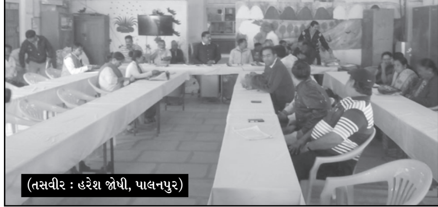
(તસવીર : હરેશ જોષી, પાલનપુર)

ડોર-ટુ ડોર કચરા કલેક્શન, સી.સી.ટી.વી કેમેરા અને સેનીટેશનના હોર્ડિંગ્સના ભાવો ઉંચા ભરી તેમાં ગેરરીતી આચરાઈ હોવાના આક્ષેપો કરતા પાલિકા વર્તુળમાં સોપો પડી ગયો હતો. વળી, તેઓએ ઓવરશ્રીજથી સીટીલાઈટ સુધીના રોડ પર ફુટપાથના બ્યુટીફીકેશનના બહાર