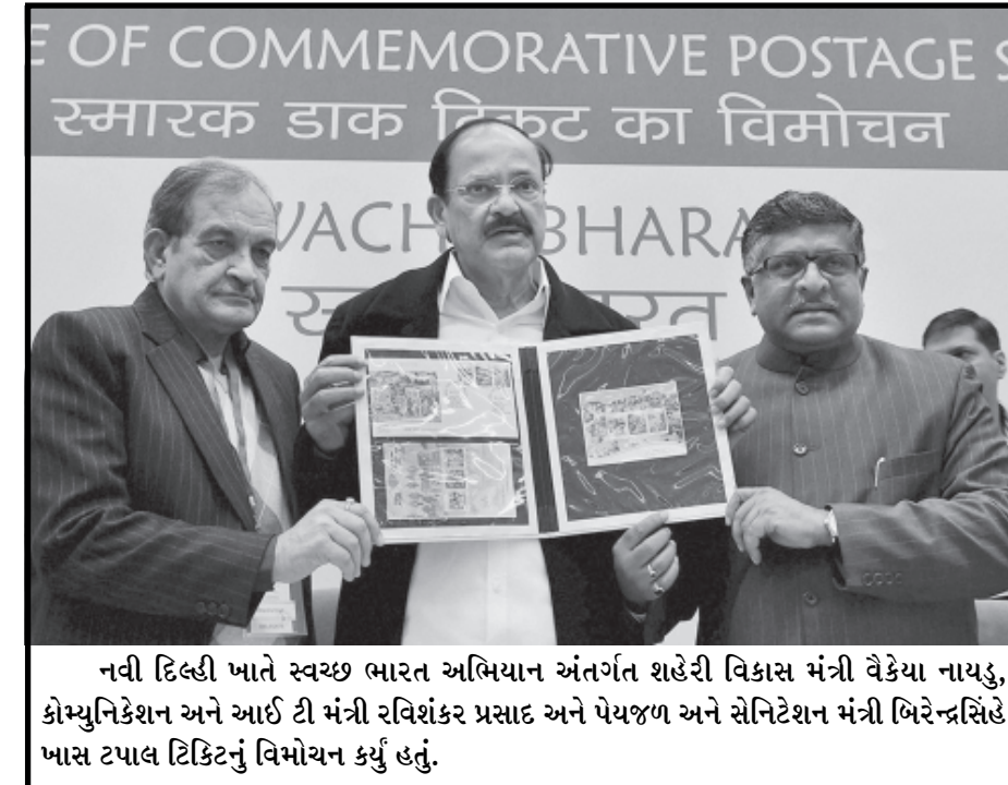
નવી દિલ્હી ખાતે સ્વચ્છ ભારત અભિયાન અંતર્ગત શહેરી વિકાસ મંત્રી વેકેયા નાયડુ, કોમ્યુનિકેશન અને આઈ ટી મંત્રી રવિશંકર પ્રસાદ અને પેયજળ અને સેનિટેશન મંત્રી બિરેન્દ્રસિંહે ખાસ ટપાલ ટિકિટનું વિમોચન કર્યું હતું.

નવી દિલ્હી, તા. ૩૦ કેન્દ્ર સરકાર દ્વારા ટોલટેક્સના નિયમોમાં ફેરફાર કરવાની હિલચાલ હાથ ધરવામાં આવી રહી છે. કેન્દ્ર સરકાર હવે પેટ્રોલ, સીએનજી અને ઈથેનોલ મિશ્રિત પેટ્રોલથી ચાલતી કાર, મોટરસાઈકલ અને સ્કુટર જેવા ખાનગી વાહનો તેમજ રાજ્ય પરિવહન (એસટી) નિગમની બસોને નેશનલ હાઈવે ઉપર ટોલટેક્સમાંથી મુક્તિ આપવાનું વિચારી રહી છે. સુત્રોના જણાવ્યા અનુસાર, ટોલટેક્સ વસુલાતમાં ખાનગી વાહનો અને બસોનો હિસ્સો ઘણો ઓછો છે અને ખાનગી વાહનો દ્વારા ટોલ પલાઝા પર વધુ અરાજકતા ઉભી થાય છે. ટોલટેક્સ કલેક્શનમાં ખાનગી વાહનો અને એસટી બસોનું યોગદાન કેવળ ૧૫ ટકા જ છે અને બાકીનો ૮૫ ટકા ટોલ ટેક્સ ટ્રૂક, ટ્રેલર, ખાનગી અને પ્રવાસી બસો અને કોમર્શિયલ વાહનો તરફથી વસુલાય છે. સરકાર પેટ્રોલ અને ડીઝલ ઉપર રોડ સેસ વધારીને પણ આવકમાં વધારો કરવાનું આયોજન કરી રહી છે. હાલની સ્થિતિ પ્રમાણે ટોલ ટેક્સની વાર્ષિક સરેરાશ આવક રૂપિયા ૧ ૧૫૦૦ કરોડ છે. જ્યારે આગામી પાંચ વર્ષમાં આ આવક વધીને રૂપિયા ૧ ૩ હજારથી ૨૦ હજાર થવાની શક્યતા વ્યક્ત કરાઈ રહી છે. આ આવકમાં નાના ખાનગી વાહનો અને સરકારી બસોનો હિસ્સો માત્ર રૂપિયા ૧ ૭૦૦થી ૨ ૭૦૦ કરોડ છે. આ ઉપરાંત નવા માર્ગ પરિવહન અને સુરક્ષા કાયદાની જોગવાઈઓ લાગુ પાડવા માટે મોટર વાહનોના વેચાણ ઉપર બે ટકા સેફ્ટી સેસ વધારવાની પણ વિચારણા હાથ ધરાઈ છે.