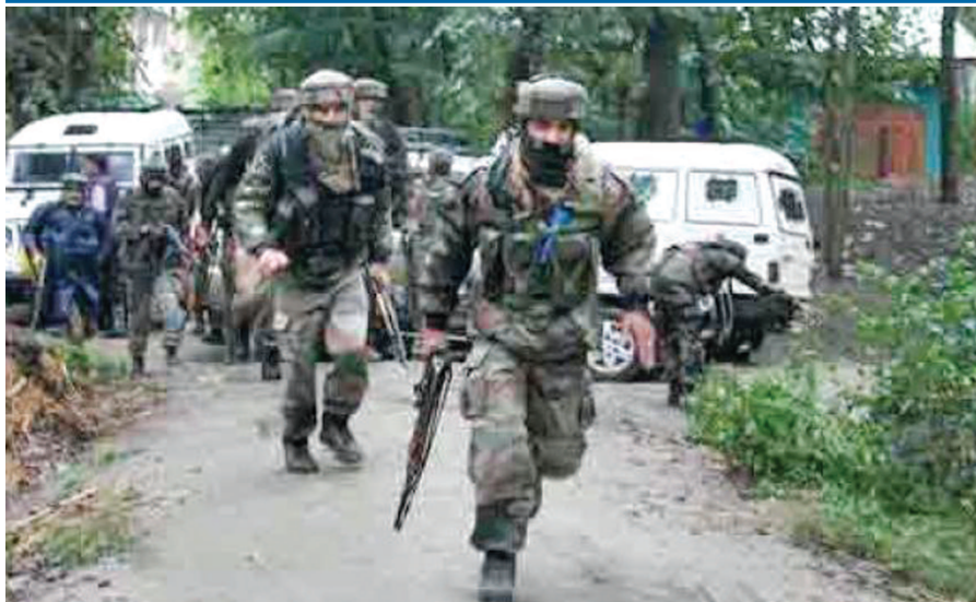
શ્રીનગર, તા. ૩૧ આપરેશન ઓલઆઉટથી હથથથી ઉઠેલા આતંકવાદીઓએ પોતાની હાજરી પુરવાર કરવાના હેતુસર વર્ષના અંતિમ દિવસે જમ્મુ કાશ્મીરના પુલવામામાં પઠાણકોટ એરબેઝની જેમ જ મોટા હુમલાને અંજામ આપ્યો હતો. ત્રાસવાદીઓએ પઠાણકોટ એરબેઝ હુમલાનું પુનરાવર્તન કર્યું હતું. સીઆરપીએફના ટ્રેનિંગ સેન્ટર પર આજે વહેલી પડે છે વાગે જેશે મોહમ્મદના ત્રાસવાદીઓએ અંધાધૂંધ ગોળીબાર શરૂ કર્યો હતો. જવાનોએ પણ તરત મોરચા સંભાળી લીધા હતા અને સામ સામે ગોળીબારની રમઝટ શરૂ થઈ ગઈ હતી. ત્રાસવાદીઓના આ હુમલામાં સીઆરપીએફના ચાર જવાનો શહીદ થયા હતા. અન્ય ત્રણ જવાન ઘાયલ થયા હતા. ત્રાસવાદીઓનો હાલના સમયનો આ સૌથી મોટો હુમલો છે. જેશે મોહમ્મદે ૨૦૧૬માં પઠાણકોટ એરબેઝ ઉપર નવા વર્ષના જન્મ વચ્ચે જ હુમલો કર્યો હતો. તે વખતે પહેલી જાન્યુઆરીની રાત્રે હુમલો કરવામાં આવ્યો હતો જેમાં સાત જવાનો શહીદ થયા હતા.

જેશે મોહમ્મદના આત્મઘાતી હુમલાખોરો ફરીવાર ત્રાટક્યા : હુમલામાં સીઆરપીએફના પાંચ જવાન શહીદ અને અન્ય ત્રણ ઘાયલ : ત્રણ ત્રાસવાદીઓ મોતને ઘાટ : પઠાણકોટ એરફોર્સ એરબેઝ જેવો હુમલો કરાચી