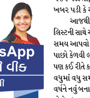
WhatsApp ઓફ ઈ વીડ નેહલ ગઢવી

પડતી મુશ્કેલીનો સામનો આપણે ચોક્કસપણે કરીએ છીએ પણ તકલીફ આવતાં પહેલાં જ એ વિષેનો વિચાર કરીને બાળકોને એ માટે તૈયાર નથી કરતા. એ જ રીતે વિમાન દરખાસ્તે દુર્ઘટનાગ્રસ્ત ન થતું હોવા છતાં દરેક હવાઈયાત્રા દરમિયાન દુર્ઘટના થાય તો તેવા સંજોગોમાં શું કરવું એ જણાવવામાં આવે છે તેમ રોજિંદા જીવનમાં પણ આવતીકાલે જ કઈક અજુગતું કે અઘટિત બની જાય તો શું કરવું એની ચર્ચા ક્યારેક ક્યારેક બાળકો સાથે કરતા રહીએ તો તેઓ દુર્ઘટનાનો સંપૂર્ણ શિકાર બનતા અટકી જશે. જે વર્ષ જતું રહ્યું અને વીતી ગયું તેમાં બની ગયેલી સારી-નરસી ઘટનાઓને આંખ બંધ કરીને એકવાર ફરીથી મનમાં વાગોળી લઈએ તો તેમાંથી ઘણું નવું જાણવા તેમ જ શીખવા મળે. આવનારા વર્ષ માટે મોટા-મોટા સંકલ્પો લેવાની કે ખૂબ મોટા પરિવર્તન આણવાની જરૂર હોતી જ નથી. પરંતુ જે કંઈ બની રહ્યું છે તે સજાગ અને સભાન રહીને અનુભવીએ તો તેમાંથી જ નાના-નાના ફેરફારો કરીને પરિસ્થિતિને વધુ સરળ અને સુગમ બનાવી શકાય છે. જીવનમાં ખરો પ્રશ્ન ત્યારે ઉદ્ભવે જ્યારે કોઈ અંગત વ્યક્તિને ગુમાવવી પડે અને રાતોરાત તમારો દિવસ કે તમારું વર્ષ જ નહિ તમારું જીવન પણ બદલાઈ જાય! ‘કંઈક તો ખોવાય છે...’