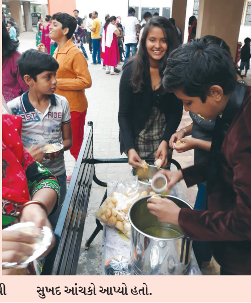
સુખદ આંચકો આપ્યો હતો.