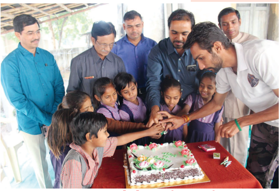
નંદનવન આશ્રમશાળા ખાતે કેક કાપી ઉજવણી કરાયું. શહેરમાં અંગ્રેજી નૂતન વર્ષની ઉજવણી ઠેર ઠેર ઉત્સાહપૂર્વક કરવામાં આવી હતી. શહેરની 'હેન્ડ ફોર હેલ્પ' સંસ્થા દ્વારા પ્રતિ વર્ષની જેમ આ વર્ષે પણ નૂતન વર્ષની ઉજવણી બાળકો સાથે કેક કાપીને કરવામાં આવી હતી. આ ઉજવણી અંતર્ગત ગાંધીનગરના સે-૧૩ ખાતેની નંદનવન આશ્રમ શાળાના બાળકોના હસ્તે કેક કટીંગ કરાયું હતું. આ પ્રસંગે સંસ્થાના સભ્યોએ બાળકોને સ્વચ્છતા તથા પર્યાવરણના મહત્વને સમજાવ્યું હતું. તેમજ નાસ્તા ચોકલેટસની ભેટ આપી બાળકોને આનંદિત કરાયા હતા.

બે દિવસમાં આર ટી ઓ તંત્રએ આગામી તા ૧૫ જાન્યુઆરી બાદ હાઇસિક્યુરીટી નંબર પ્લેટ વિનાના વાહનો પાસેથી દંડ વસૂલી કરવાના પગલા લેવામાં આવનાર છે. જયારે જૂના વાહનોમાં પણ હાઇસિક્યુરીટી નંબર પ્લેટ લગાવવા માટે આર ટી ઓ તંત્ર દ્વારા અભિયાન હાથ ધરાયું છે. જેમાં ગત બે દિવસના અંતે ૧ હજાર જેટલી નવી નંબર પ્લેટ તૈયાર કરવામાં આવી છે. જૂના વાહનોમાં હાઇસિક્યુરીટી નંબર પ્લેટથી સજજ કરવા માટે વધુ દિવસો બાકી રહ્યા નથી ત્યારે આર ટી ઓ તંત્ર માટે પણ ટુંકાગાળામાં આ કામગીરી કરવાનું ચેલેન્જરૂપ બન્યું છે. આગામી ૧૫મી બાદ હાઇસિક્યુરીટી નંબર પ્લેટ વગરના વાહનચાલકો દંડાશે. જયારે હાઇસિક્યુરીટી નંબર પ્લેટ ન ધરાવતા વાહનોને આવરી લેવા માટે આર ટી ઓ તંત્ર દ્વારા સુંબેશ હાથ ધરવામાં આવી છે. જે કે હજુ લાખો વાહનો હાઇ સિક્યુરીટી નંબર પ્લેટ વિનાના હોવાનું ધ્યાને આવ્યું છે. આર ટી ઓ તંત્ર દ્વારા આ માટે ગત બે દિવસ કેમ્પનુ આયોજન કરવામાં આવ્યું હતું. આ દરમિયાન ૧ હજાર જેટલી નંબર પ્લેટ તૈયાર કરવામાં આવી હતી. નવી નંબર પ્લેટ લગાવવા માટે શહેર-જિલ્લામાં ઝડપથી કામગીરી થાય તેવા પ્રયાસો કરવામાં આવી રહ્યા છે. પરંતુ નિયત સમયગાળામાં આ કામગીરી પૂર્ણ કરવાનું આર ટી ઓ તંત્ર માટે પણ પડકારરૂપ બન્યું હોવાનું મનાઈ રહ્યું છે.