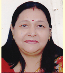
સજનભાઈ રહેવર લાયોનેસ કલબ