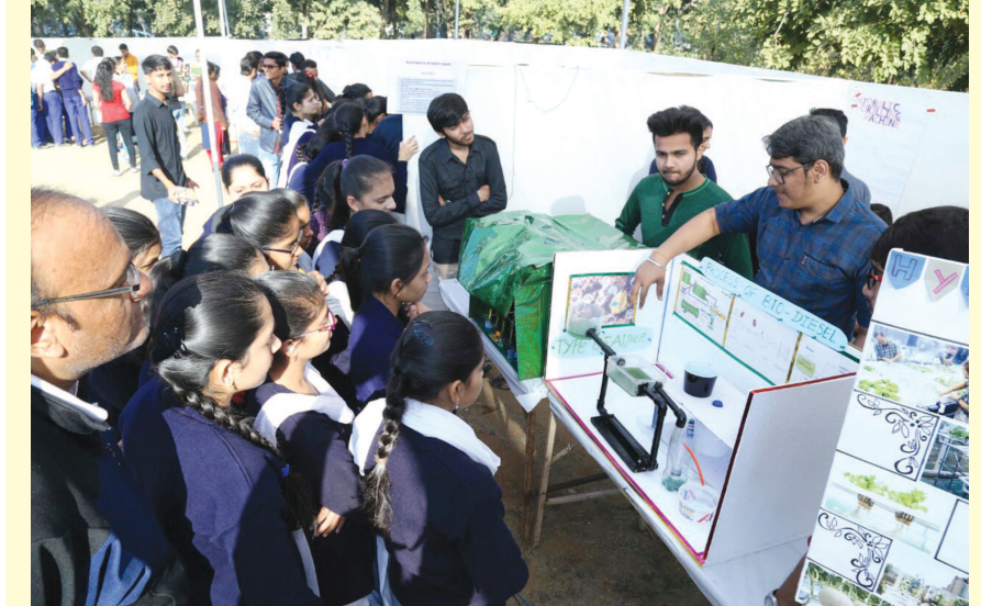
સાયન્સ - ટેકનોલોજી એકઝીબિશન : કે ડી કમ્પ્લેક્સ ખાતે યોજાયેલ સાયન્સ અને ટેકનોલોજી એકઝીબિશન નિહાળવા વિદ્યાર્થીઓ મોટી સંખ્યામાં ઉમટે છે... વિવિધ સંશોધનને રજૂ કરતા પ્રયોગો અને પ્રોજેક્ટ ભારે આકર્ષણ જમાવી રહ્યા છે... વિદ્યાર્થીઓ દ્વારા તૈયાર કરાયેલ અવનવા પ્રોજેક્ટસ આવાતીકાલની ઉજ્જવળતા રજૂ કરે છે...