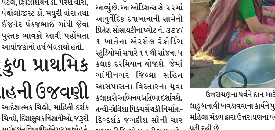
ઉત્તરાયણના પર્વને દાન માટેનો શ્રેષ્ઠ સમય ગણવામાં આવે છે ત્યારે આપણી સંસ્કૃતિમાં આ સમયે શ્યાનને લાડુ બનાવી ખવડાવવાના કાર્યને પુણ્યકાર્ય ગણવામાં આવે છે ત્યારે શહેરના સે-૨ ૪ શિવશક્તિ ટેનામેન્ટના ગોપી મહિલા મંડળ દ્વારા ઉત્તરાયણના પર્વ નિમિત્તે શ્યાન માટે લાડુ બનાવવાની કામગીરી કરતી બહેનો તસવીરમાં નજરે પડી રહી છે.

ગાંધીનગરની ગુજરાતી ફિલ્મ બનાવતી કંપની તન્વી-ગ્રેવિશા પિક્ચર્સ દ્વારા આગામી ફિલ્મ ‘વાહ, શું લવ છે?’ માટે તા. ૯મી જાન્યુઆરી મંગળવારે કલાકારોના ઓડિશનનું આયોજન કરવામાં આવ્યું છે. આ ઓડિશન્સ સે-૨ માં આયુર્વેદિક દવાપાનાની સામેની પ્રિતેશ સોસાયટીના પ્લોટ નં. ૩૦૪/૧ ખાતેના એરસેલ રેકોર્ડિંગ સ્ટુડિયોમાં સવારે ૧૧ થી સાંજના ૫ કલાક દરમિયાન યોજાશે. જેમાં ગાંધીનગર જિલ્લા સહિત આસપાસના વિસ્તારના યુવા કલાકારો અભિનય પ્રતિભા દર્શાવશે.