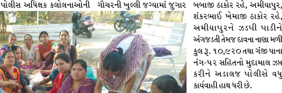
મળતી માહિતી મુજબ નાયબ પોલીસ અધિક્ષક કલોલનાઓની સુચના મજબૂત અડાલજ પોલીસ સ્ટેશન વિસ્તારમાં જુગારની પ્રવૃત્તિ નેસ્તાબુદ કરવા અંગે સુચના મુજબ અડાલજ પીઆઈના માર્ગદર્શન હેઠળ સર્વેલન્સ સ્કોડ પીએસઆઈ એ. જી. એનુરકાર તેમજ સ્ટાફના કર્મચારીઓ અડાલજ વિસ્તારમાં પેટ્રોલીંગમાં હતા તે દરમિયાન અ. પો. કો. મહેન્દ્રસિંહને ખાતમી મળી હતી કે અમીયાપુર ગામ તરફ જતા કાચા નાળીયામાં ઝુંડાલ ગામની સીમમાં ઓએનજીસીના વેલ નજીક ગૌચરની ખુલ્લી જગ્યામાં જુગાર

ગાંધીનગર, તા. ૮ ગાંધીનગર જિલ્લાના ઝુંડાલ ગામની સીમમાં ઓ. એન. જી. સી. ના વેલ નજીક ગૌચરની જમીનમાં કુડાળુ કરીને પાના પાત્ર પર હારજીતનો જુગાર રમતા ૮ શકુનીઓને સર્વેલન્સ સ્કોડની ટીમના સભ્યોએ રૂ. ૧૦,૯૨૦ના મુદામાલ સાથે ઝડપી પાડ્યા છે. બનાવ અંગે અડાલજ પોલીસે ગુનો નોંધી કાયદેસરની કાર્યવાહી હાથ ધરી છે.