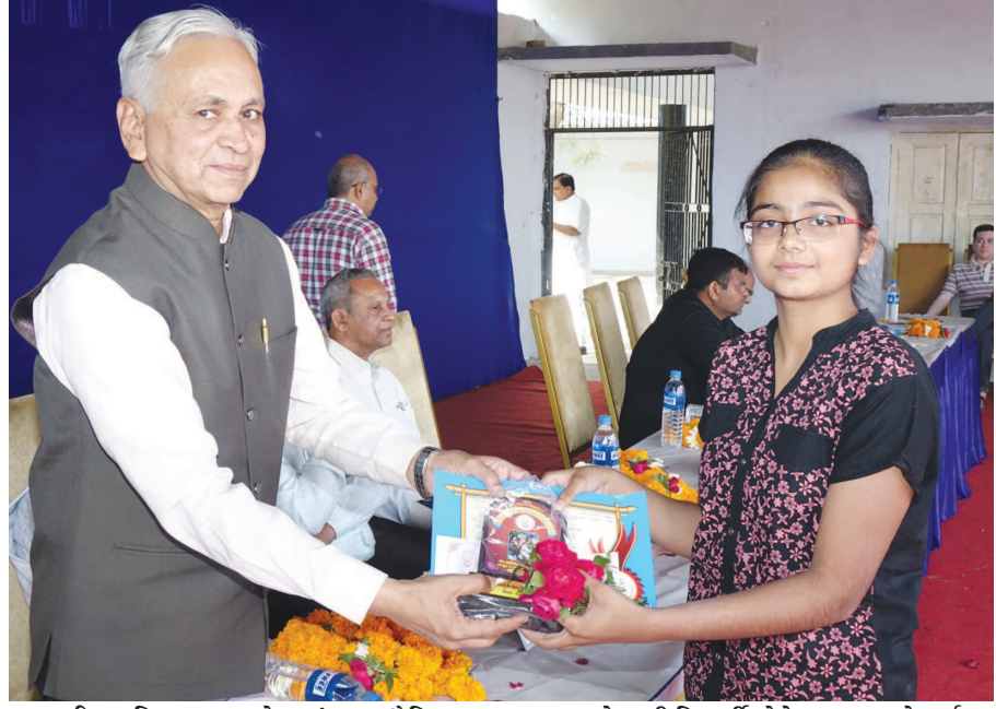
ઈનામ વિતરણ સમારોહ : દંઢાવ્ય ઓદિય્ય બ્રહ્મ સમાજના તેજસ્વી વિદ્યાર્થીઓને સન્માનવાનો કાર્યક્રમ વાવોલ એમ. બી. પટેલ વિદ્યાલય ખાતે યોજાયો હતો. સમાજના તેજસ્વી છાત્રોને માનવંતા મહેમાનોના વરદહસ્તે ઈનામ તથા સન્માનપત્ર એનાયત કર્યા હતા. આ પ્રસંગે સમાજના હોદ્દેદારો અને સભ્યો મોટી સંખ્યામાં ઉપસ્થિત રહ્યા હતા.