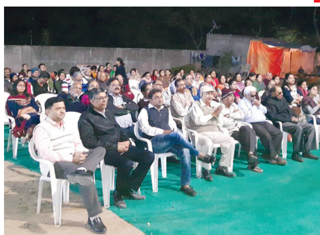
સ્નેહમિલન : સેક્ટર-૨૧ બ્રહ્મ સમાજ દ્વારા સ્નેહમિલન કાર્યક્રમ યોજાયો હતો. જેમાં તેજસ્વી વિદ્યાર્થીઓનું સન્માન પણ કરાયું હતું. આ પ્રસંગે સમાજના બાળકો દ્વારા ગીત-સંગીતનો કાર્યક્રમ યોજાયો હતો. સમાજના આગેવાનો અને સભ્યો મોટી સંખ્યામાં ઉપસ્થિત રહી યુવાનોને પ્રોત્સાહિત કર્યા હતા.

મેઘરજના નાગરિકો દ્વારા માર્કેટયાર્ડના ચેરમેન તથા ટીડીઓને લેખિત રજૂઆત કરાઈ જેમાં જણાવ્યું હતું કે મેઘરજ ખેતીવાડી ઉત્પન્ન બજાર સમિતિ આગળ બનાવવામાં આવેલ દુકાનોની સામે કેટલાક લોકો દબાણ ઉભુ કરી બેઠા છે અને કેટલાક વેપારીઓ દ્વારા કાયમી ધોરણે તંબુનાણી ફૂટપાથ ઉપર કબ્જો જમાવી દેતાં રાહદારીઓને ભારે હાલાકી વેઠવાનો વારો આવી રહ્યો છે. જ્યારે ગેરકાયદેસર રીતે લગાવવામાં આવેલા મોટા હોર્ડિંગ્સ, ટ્રાફિક જેવી સમસ્યાઓ સર્જી રહ્યા છે. ત્યારે સત્વરે આ દબાણો દૂર કરવા અને જગાઓ ખુલ્લી કરવા અરજદારોએ માંગ ઉઠાવી હતી.