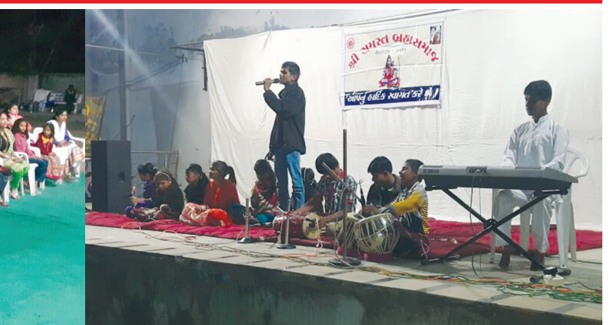
સ્નેહમિલન : સેક્ટર-૨૧ બ્રહ્મ સમાજ દ્વારા સ્નેહમિલન કાર્યક્રમ યોજાયો હતો. જેમાં તેજસ્વી વિદ્યાર્થીઓનું સન્માન પણ કરાયું હતું. આ પ્રસંગે સમાજના બાળકો દ્વારા ગીત-સંગીતનો કાર્યક્રમ યોજાયો હતો. સમાજના આગેવાનો અને સભ્યો મોટી સંખ્યામાં ઉપસ્થિત રહી યુવાનોને પ્રોત્સાહિત કર્યા હતા.

ઉત્તરભારતમાં જોરદાર બરફ વર્ષા સાથે ચાલતી શીતલહેરની ગંભીર અસર ગુજરાત રાજ્ય સહીત અરવલ્લી જિલ્લામાં અનુભવતા લોકો ઠંડી સામે રક્ષણ મેળવવા કામકાજ સિવાય ઘર બહાર નીકળવાનું ટાળી રહ્યા છે. ત્યારે મોડાસા શહેરમાં નગરજનો કાલિલ ઠંડીથી ક્રુણ ઉઠતા લોકો સાંજ પડતાની સાથે ઢેર ઢેર તાપણા કરી ઠંડીથી બચવા તાપણાનો આશરો લેતા નજરે પડી રહ્યા છે.