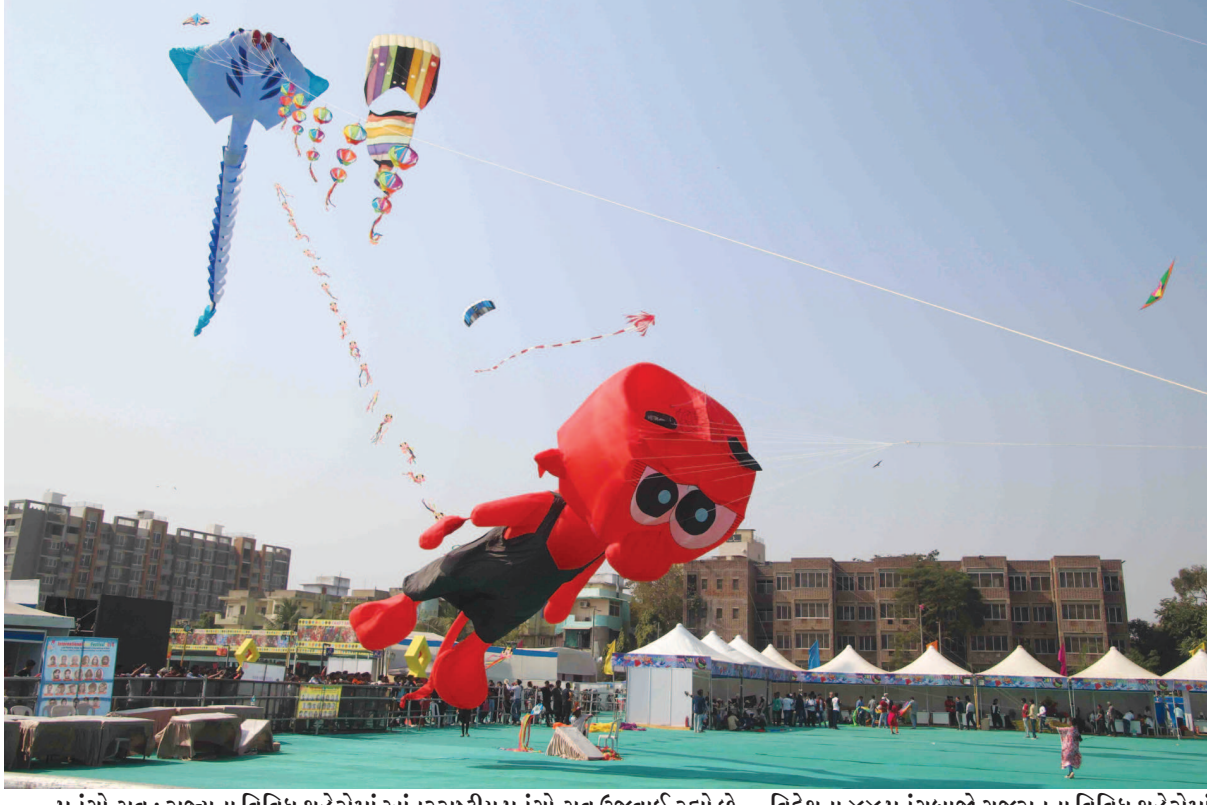
પતંગોત્સવ : રાજ્યના વિવિધ શહેરોમાં આંતરરાષ્ટ્રીય પતંગોત્સવ ઉજવાઈ રહ્યો છે.... વિદેશના ૪૪ પતંગબાજો ગુજરાતના વિવિધ શહેરોમાં અવનવા પતંગો ઉડાડી અનોખું નિદર્શન કરે છે... પાલનપુર, ખંભાત, ગાંધીધામ, મોડાસા, જેવા શહેરોમાં પતંગોત્સવ માણવા મોટી સંખ્યામાં પતંગરસિયાઓ ઉમટે છે... રીવરફ્રન્ટ ખાતે પતંગોત્સવના પ્રારંભે દેશ-વિદેશના પતંગબાજોએ અવનવા પતંગ ઉડાડવાની કળા પ્રદર્શિત કરી હતી...

સરકારની વર્તમાન અવધિનું અંતિમ પૂર્ણ બજેટ રહેશે. આ બજેટમાં સરકાર મધ્યમવર્ગ જેમાં ખાસ કરીને પગારદાર વર્ગ આવે છે તેને મોટી રાહત આપવા ગંભીરતાપૂર્વક વિચારી રહી છે. સરકાર ઈચ્છે છે કે, આ વર્ગને રિટેલ કુશાવાના પ્રભાવથી રાહત મળે. એટલે કે છુટક મોઘવારીની અસર મધ્યમવર્ગને ન થાય તેની ખાતરી કરવાના પ્રયાસ થઈ રહ્યા છે. સુનોના કહેવા મુજબ નાણામંત્રી અરુણ જેટલી પહેલી ફેબ્રુઆરીના દિવસે રજૂ કરવામાં આવનાર સામાન્ય બજેટમાં ટેક્સ સ્લેબમાં વ્યાપક ફેરફાર કરી શકે છે. પાંચથી ૧૦ લાખ રૂપિયાની વાર્ષિક આવકને ૧૦ ટકા ટેક્સની હદમાં લાવવામાં આવી શકે છે જ્યારે ૧૦થી ૨૦ લાખ રૂપિયાની આવક પર ૨૦ ટકા તથા ૨૦ લાખ રૂપિયાથી વધુની આવક પર ૩૦ ટકાના દરે કરવેરા લાગુ કરવાની તૈયારી છે.