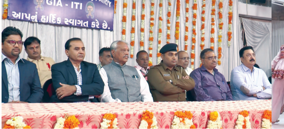
સાબરકાંઠા જિલ્લાનાં પ્રાંતિજ ખાતે આવેલ શ્રી સી. એસ. દેસાઈ ટેકનિકલ ઈન્સ્ટીટ્યુટ ખાતે સાંસ્કૃતિક કાર્યક્રમો તેમજ ઈનામ વિતરણ કાર્યક્રમ યોજાયો. પ્રાંતિજ કેળવણી મંડળ સંચાલિત શ્રી સી. એસ. દેસાઈ આઈ. ટી. આઈ ખાતે સાંસ્કૃતિક કાર્યક્રમ નું આયોજન કરવામાં આવ્યું હતું જેમાં તાલિમમાર્થી વિદ્યાર્થીઓ દ્વારા નાટક, ગરબો, રાસ, આદિવાસી નૃત્ય જેવાં સાંસ્કૃતિક કાર્યક્રમોમાં ભાગ લઈને વિદ્યાર્થીઓએ બહારથી આવેલ મહેમાનો તથા વાલીઓ તથા પ્રશિક્ષકોના દિલ જીતી લીધાં હતાં.

જો કે કેટલાક સંચાલકો આ મામલે કોર્ટમાં ગયા હતા પરંતુ નામદાર કોર્ટે સરકારે ઘડેલા કાયદાને યોગ્ય ગણ્યો છે ત્યારે રાજ્ય સરકારને તેનો અમલ કરાવવા માટે મોકળુ મેદાન મળ્યું છે જે અંતર્ગત રાજ્ય સરકારના પ્રાથમિક નિયામક દ્વારા તાજેતરમાં તમામ જિલ્લાઓના પ્રાથમિક શિક્ષણાધિકારીઓને આદેશ કરી કોશનમનીના નામે લેવાયેલા નાણાં જે તે વિદ્યાર્થીને ત્રીસ દિવસમાં પરત કરી તેની જાણ શાળાના આચાર્ય અથવા સંચાલકે જિલ્લા પ્રાથમિક શિક્ષણાધિકારીને કરવાની રહેશે.