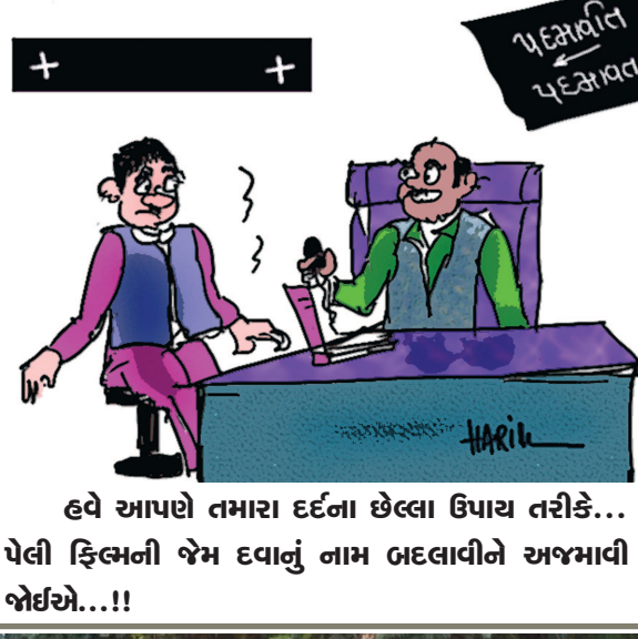
હવે આપણે તમારા દર્દના છેલ્લા ઉપાય તરીકે... પેલી ફિલ્મની જેમ દવાનું નામ બદલાવીને અજમાવી બોઈએ...!!