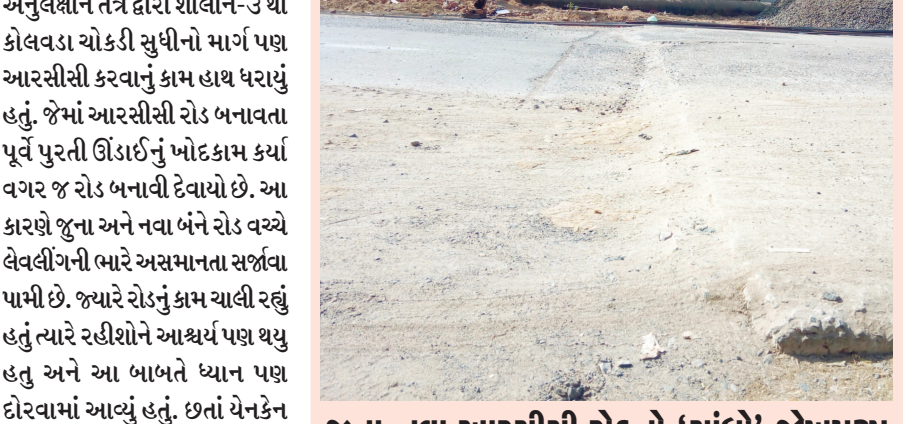
જુના-નવા આરસીસી રોડનો 'સાંધો' જોખમરૂપ વાવોલની કોલવડા ચોકડીથી કિર્તિધામ સોસાયટી સુધીના માર્ગમાં ખૂબ અસમાનતા જોવા મળે છે. વળી, અલગ અલગ સમયે બનેલા આરસીસી રોડના જુદા જુદા ભાગોને અત્યંત બેદરકારી ભરેલા અસમાન લેવલીંગને કારણે આ વિસ્તારના વાહનચાલકો માટે ભારે જોખમ ઉભું થવા પામ્યું છે. સત્વરે આ માર્ગનું લેવલીંગ સરખું કરી જોડાણના ભાગે યોગ્ય ઢાળ સાથેનું જોડાણ કરાય તેવી આ વિસ્તારના રહીશોમાં માંગ ઉઠવા પામી છે.

શાલીન-૩ સોસાયટી સુધી આરસીસી રોડ બનાવાયેલો હતો. તાજેતરમાં વિધાનસભાની ચૂંટણીઓને અનુલક્ષીને તંત્ર દ્વારા શાલીન-૩ થી કોલવડા ચોકડી સુધીનો માર્ગ પણ આરસીસી કરવાનું કામ હાથ ધરાયું હતું. જેમાં આરસીસી રોડ બનાવતા પૂર્વે પુરતી ઊંડાઈનું ખોદકામ કર્યા વગર જ રોડ બનાવી દેવાયો છે. આ કારણે જુના અને નવા બંને રોડ વચ્ચે લેવલીંગની ભારે અસમાનતા સર્જવા પામી છે. જ્યારે રોડનું કામ ચાલી રહ્યું હતું ત્યારે રહીશોને આશ્ચર્ય પણ થયું હતું અને આ બાબતે ધ્યાન પણ દોરવામાં આવ્યું હતું. છતાં યેનકેન પ્રકારે કામ નિપટાવી દેવામાં આવ્યું હતું. હવે આ અસમાન રોડનું જોડાણ જ્યાં શાલીન-૩ સોસાયટી પાસે થાય છે ત્યાં યોગ્ય ઢાળ આપીને જોડાણ કરવાનું પણ તંત્રએ મુનાસિબ સમજ્યું નથી જેના કારણે અનેક વાહનચાલકો પરેશાનીનો ભોગ બની રહ્યાં છે.