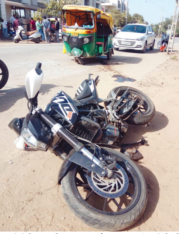
આરસીસી રોડના કારણે અકસ્માત સર્જાયો હતો. જેમાં એક બાઈક સવારનો આબાદ બચાવ થવા સાથે એક રીક્ષાચાલક ઘવાયો હતો. જુના આરસીસી રોડ અને નવા આરસીસી

ગાંધીનગર, તા. ૨૩ રોડ વચ્ચે લેવલીંગની અસમાનતા રાખવાના તથા બંનેના જોડાણના ભાગે પણ ગંભીર બેદરકારીભરી