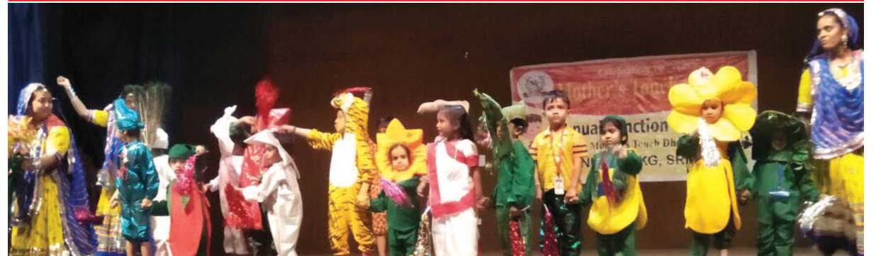
પેથાપુર ખાતે કાર્યરત સ્કૂલ મધર ટચનો વાર્ષિકોત્સવ ગાંધીનગર ટાઉનહોલ ખાતે યોજાયો હતો. મનમોહક વેશભૂષાઓમાં સજ્જ બાળકોએ