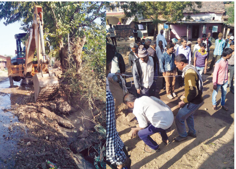
મોડાસાના રબિયાલ ગામે આરસીસી રોડના નવીનીકરણ માટે દબાણ હટાવ્યા