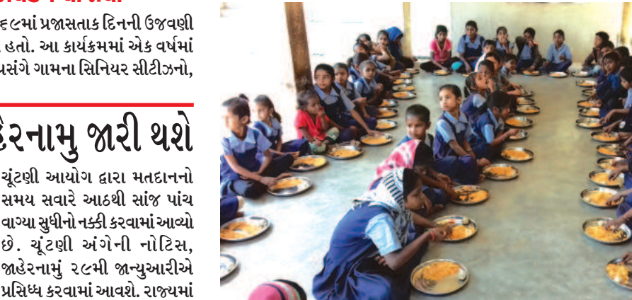
શ્રી ગજાન સેવા સમિતિ દ્વારા અનાજ તેમજ કપડાનું વિતરણ કરાયું

ગાંધીનગર, તા. ૨૮ ગાયત્રી શક્તિપીઠ ગાંધીનગર અને અંધવ નિવારણ સોસાયટીના સહયોગથી જાન્યુઆરી ૨૦૧૮ દરમિયાન ગાંધીનગર જિલ્લાના ૯ ગામમાં જાન્યુઆરી ૨૦૧૮ દરમિયાન નિઃશુલ્ક નેત્ર નિદાન કેમ્પનું આયોજન કરવામાં આવ્યું હતું. જેમાં ૧૧૧૩ દર્દીઓને ચરમાનું વિતરણ રાહત દરે કરવામાં આવ્યું હતું. જ્યારે ૫૨ જેટલા દર્દીઓએ