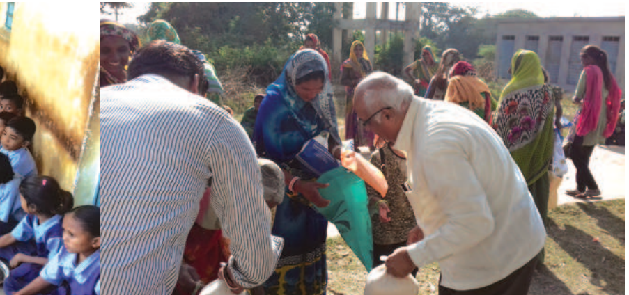
શ્રી ગજાન સેવા સમિતિ દ્વારા અનાજ તેમજ કપડાનું વિતરણ કરાયું