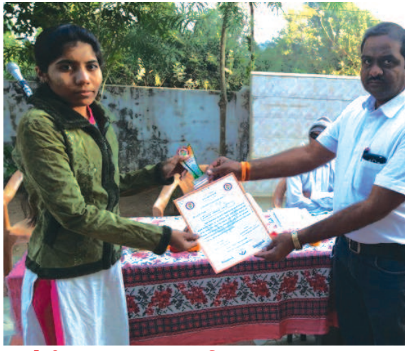
મગોડી રતનપુર લાટ પ્રાથમિક શાળા દ્વારા ધ્વજવંદન કાર્યક્રમ યોજાયો

ગાંધીનગર, તા. ૨૮ જાન્યંત ગ્રુપ ઓફ કલોલ મેઈન દ્વારા કલોલ તાલુકાના બોરીસણા ગામ ખાતે આવેલ ગોપાલનગરની સરકારી પ્રાથમિક શાળા ખાતે ધ્વજવંદન કાર્યક્રમ યોજાયો હતો. આ કાર્યક્રમમાં દેશભક્તિ ગીતો અને સાંસ્કૃતિક કાર્યક્રમ શાળાના વિદ્યાર્થીઓ દ્વારા પ્રસ્તુત કરવામાં આવ્યો હતો. સાથે જાન્યંત ગ્રુપ દ્વારા ટિકરીઓને જન્મ આપનાર માતાઓનું સન્માન પત્ર અને સ્મૃતિચિન્હ આપી સન્માન કરવામાં આવ્યું હતું. ગાંધીનગર સરકારી પ્રાથમિક શાળામાં વિદ્યાર્થીઓ દ્વારા સ્વાગતગીત અને સાંસ્કૃતિક