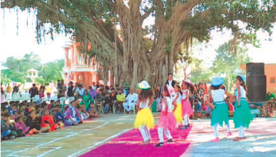
ટીંટોડા પ્રાથમિક શાળામાં પ્રજાસત્તાક દિન ઉજવાયો

ગાંધીનગર, તા. ૨૮ ગાંધીનગરના શહેર વસાહત મહામંડળ દ્વારા મહાનગર પાલિકાના આગામી નાણાકીય વર્ષ માટેના બજેટ અંગે સૂચનો કરવામાં આવ્યાં છે. આ સૂચનોમાં હાલના સફાઈવેરોમાં ઉભી થતી વિસંવાદિતતા દૂર કરવા તથા સફાઈવેરોમાં રાહત આપવા અંગેની માંગણીનો સમાવેશ થાય છે. મહાનગરપાલિકા દ્વારા હાલમાં વસુલાતો સફાઈવેરોના મકાન કે નાની દુકાન અને મોટા મકાન કે મોટી દુકાન ધારકો તમામને એક જ લાકડીએ હાંકતો હોય તે પ્રકારે એક સરખો લેવામાં આવે છે. જેમાં મધ્યમ અને નિમ્ન મધ્યમ વર્ગને ભોજ સહન કરવો પડી રહ્યો છે. આ સફાઈવેરોને મકાન કે દુકાનના કાર્પેટ એરિયા મુજબ કરવા શહેર વસાહત મહામંડળ દ્વારા સૂચન કરવામાં આવ્યું છે. આ ઉપરાંત શહેરની હોટલ-રેસ્ટોરન્ટ માટે સફાઈવેરો માટે અલગથી વિચારવા સાથે મેડીકલ વેસ્ટના નિકાલની યોગ્ય વ્યવસ્થા ગોઠવવા પણ માંગ કરવામાં આવી છે. આ સાથે મહામંડળ દ્વારા મનપાને સ્માર્ટસિટી પ્રોજેક્ટ અને મહાત્મા ગાંધી સફાઈ અભિયાન અંતર્ગત મળતી વધારાની ગ્રાન્ટ તથા સરકારી સહાયને પગલે સફાઈવેરોના દરમાં રાહત આપવા પણ માંગ કરવામાં આવી છે. આ સાથે પ્રદર્શન મેદાન, સરકારી ઈમારતો, વ્યાપારી ધોરણે ચાલતી સંસ્થાઓ જેમના દ્વારા સફાઈવેરો ભરવામાં નથી આવતો તેની સામે કાયદાકીય પગલાં લેવા પણ અનુરોધ કરવામાં આવ્યો છે. મનપાએ આ બજેટમાં વર્ધ્ય ખર્ચાઓ પર નિયંત્રણ મુકી નગરજનોને કરવેરામાં રાહત આપવા વસાહત મહામંડળ દ્વારા વિનંતી કરવામાં આવી છે.