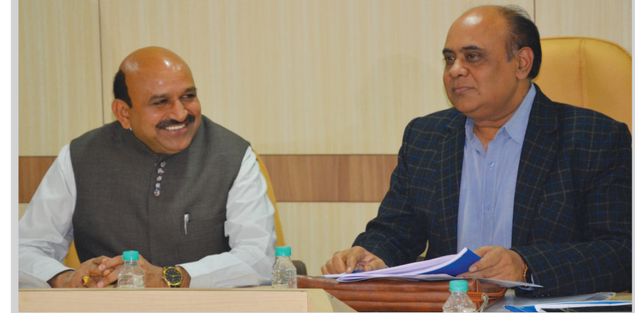
એરિયા ધ્યાને રાખી તેમાં આંશિક સુધારા સાથે રૂ. ૫૦ લાખની આવક રૂ. ૬૫૦ લેખે આ દર વસુલવાની દરખાસ્ત ડ્રાફ્ટ બજેટમાં કરી સૌને

કર્ચો છે. સારી સેવા માટે સારો ટેક્સ એવી વાત કરી તેમણે મિલકતવેરાની આવકનો લક્ષ્યાંક ઘટાડવાનો પ્રયાસ કર્યો છે પણ તે ગળે ઉતરે