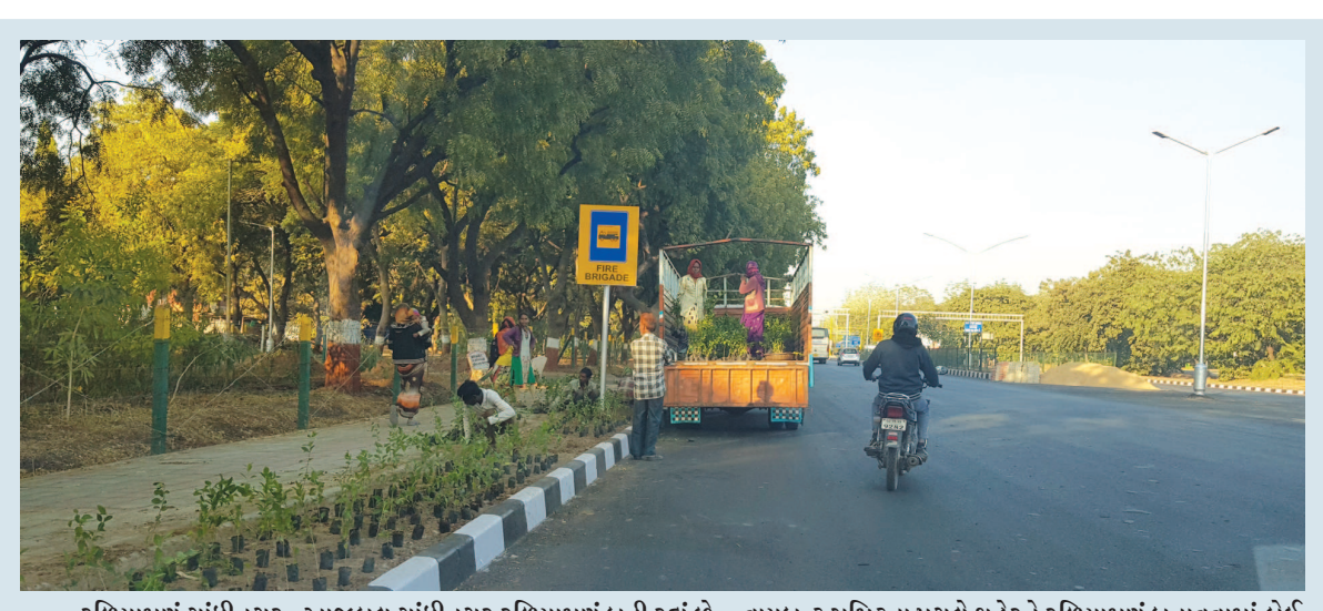
રળિયામણું ગાંધીનગર - આજકાલ ગાંધીનગર રળિયામણું બની રહ્યું છે... વાયબ્રન્ટ સમિટના પગલે શહેરને રળિયામણું બનાવવામાં કોઈ ક્યાશ ન રાખવા તંત્ર રાત-દિવસ એક કરી રહ્યું છે... ધ-માર્ગ અને ય-માર્ગની ફુટપાથોના વળાંકો પર આકર્ષક હુલ-છોડ અને મહેદીના રોપાનું વ્યાપક વાવેતર થઈ રહ્યું છે... અને આગામી દસ દિવસમાં શહેરનો નજારો બદલાઈ જશે... મહાત્મા મંદિર હોય કે શહેરના રાજમાર્ગો હોય, એકઝીબિશન સેન્ટર હોય કે એરપોર્ટ રોડ હોય ચારેય તરફ તડામાર તૈયારીઓ ચાલી રહી છે...