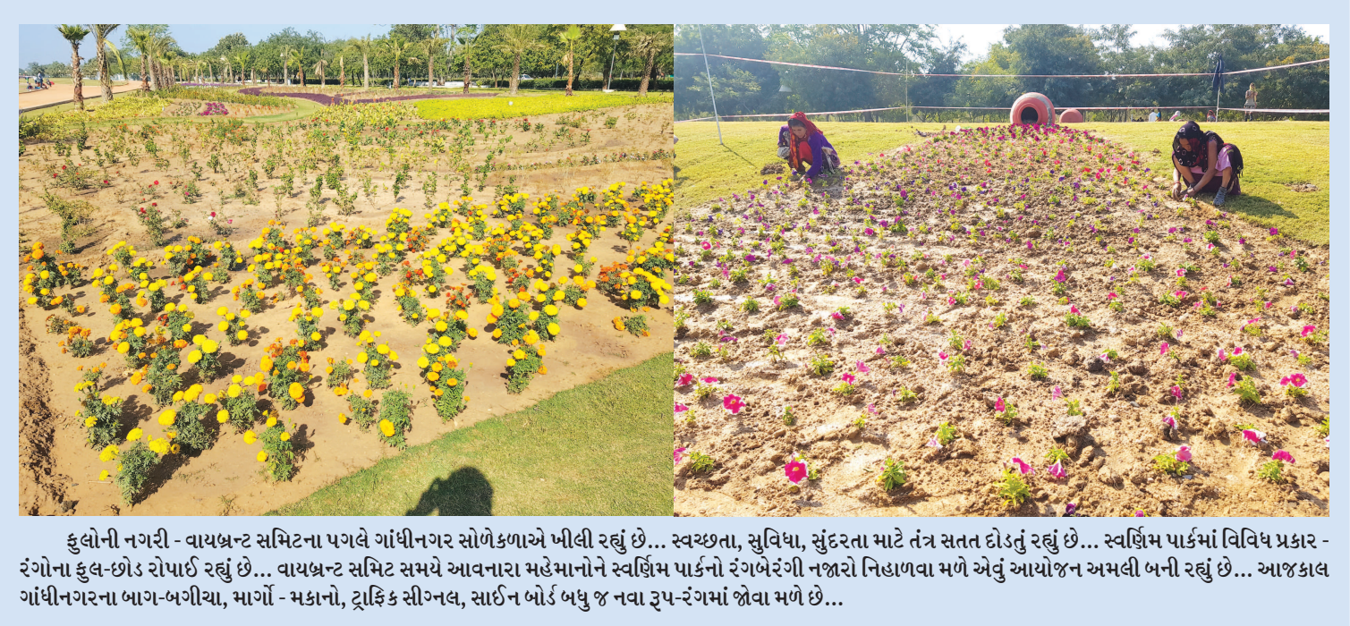
હુલોની નગરી - વાયબ્રન્ટ સમિતિના પગલે ગાંધીનગર સોળેકળાએ ખીલી રહ્યું છે... સ્વચ્છતા, સુવિધા, સુંદરતા માટે તંત્ર સતત દોડતું રહ્યું છે... સ્વર્ણિમ પાર્કમાં વિવિધ પ્રકાર - રંગોના ફુલ-છોડ રોપાઈ રહ્યું છે... વાયબ્રન્ટ સમિતિ સમયે આવનારા મહેમાનોને સ્વર્ણિમ પાર્કનો રંગબેરંગી નજારો નિહાળવા મળે એવું આયોજન અમલી બની રહ્યું છે... આજકાલ ગાંધીનગરના બાગ-બગીચા, માર્ગો - મકાનો, ટ્રાફિક સીગ્નલ, સાઈન બોર્ડ બધુ જ નવા રૂપ-રંગમાં જોવા મળે છે...

એક લાભાર્થી મહિલા ચક્કર ખાઈ બેભાન બની કલેક્ટર, ડીડીઓ, કમિશ્નર સ્ટોલે સ્ટોલે ફર્યાદ કોબા પ્રેક્ષા ભારતી ખાતે યોજાયેલ ગરીબ કલ્યાણ મેળામાં લાભાર્થીઓના લાભનું વિતરણ ચાલી રહ્યું હતું ત્યારે એક લાભાર્થી મહિલાને ચક્કર આવ્યા હતા અને બેહોશ થઈ ગઈ હતી. હાજર તબીબી ટીમે સારવાર આપી વધુ સારવાર માટે એમ્બ્યુલન્સની મદદથી ગાંધીનગર ખસેડાઈ હતી. આજે ગરીબ કલ્યાણ મેળામાં મંત્રી દિલીપ ઠાકોરને જે દરવાજે ઉતારવાના હતા તેના બદલે બીજા દરવાજે તેમની ગાડી પહોંચતાં તંત્રના અધિકારીઓ ત્યાં પહોંચ્યા હતા. આજના ગરીબ કલ્યાણ મેળામાં ૨ ખાનગી બસો સહિત કુલ ૫૭ બસો હતા. જેમાં મહાનગરપાલિકાની સીટી સર્વિસની બસો પણ હતી. આજે ગરીબ કલ્યાણ મેળામાં આવેલા રાજ્યના શ્રમમંત્રી દિલીપ ઠાકોરને જિલ્લા ભાજપના હોદ્દાદારોનો પરિચય કરાવતા હતા ત્યારે તેમને કહ્યું કે કામ કરે તે બધા કાર્યકર્તા. લોકો સાથે સંપર્ક વધારો. ગરીબ કલ્યાણ મેળાની સાથે સાથે ● અનુસંધાન પાન-૭ પર