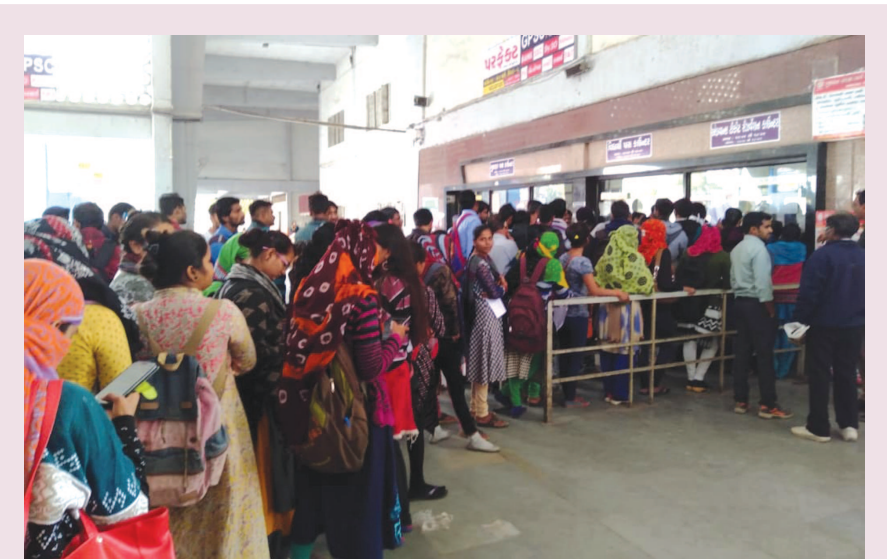
પરીક્ષાર્થીઓ લાઈનમાં... - લોકરક્ષક દળના પરીક્ષાર્થીઓની બસના ફી ટીકીટ માટે લાંબી લાઈનો લાગી હતી... ગયા મહિને યોજાયેલ લોકરક્ષક દળની પરીક્ષાનું પેપર ફુટી જતા રદ કરાયેલી પરીક્ષા સામે ઉઠાપોઢ થતાં રાજ્યના ૮ લાખ પરીક્ષાર્થીઓને પરીક્ષા કેન્દ્ર સુધી જવા - આવવાનું ભાડુ રાજ્ય સરકાર ચુકવશે એવી જાહેરાત કરાઈ હતી... છેલ્લા બે દિવસથી રાજ્યભરના બસ ડેપો પર પરીક્ષાર્થીઓએ ફી - ટીકીટ મેળવવા લાઈનો લગાવી હતી... એક તરફ પરીક્ષાની આખરી તૈયારીનો સમય અને બીજી તરફ બસ ભાડાની લાઈન... આ પણ એક પરીક્ષા જ છે ને....