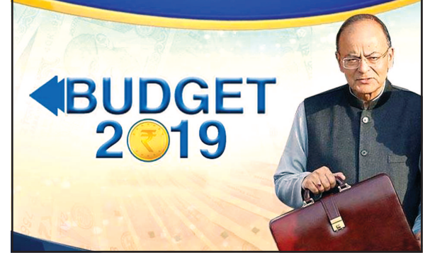
● અનુસંધાન પાન-૭ પર

નવીદિલ્હી, તા. ૯ સંસદનું બજેટ સત્ર ૩૧મી જાન્યુઆરીથી ૧૩મી ફેબ્રુઆરી સુધી ચાલનાર છે. નાણામંત્રી અરુણ જેટલી પહેલી ફેબ્રુઆરીના દિવસે વચગાળાનું બજેટ રજૂ કરનાર છે. સરકારના સુત્રો પાસેથી આ અંગેની માહિતી આપવામાં આવી છે. બજેટ સત્ર ક્યારથી શરૂ થશે તેને લઈને ચાલી રહેલી અટકળોનો અંત આવી ગયો છે. રાજકીય બાબતો અંગેની કેબિનેટ સમિતિમાં આ અંગેનો નિર્ણય લેવામાં આવ્યો હતો. લોકસભાના આખરી સત્ર તરીકે તેને જોવામાં આવે છે. કારણ કે એપ્રિલ અને મે મહિનામાં સામાન્ય ચૂંટણી આવી શકે છે. વચગાળાનું બજેટ સમગ્ર વર્ષના બજેટ તરીકે હોય છે જેમાં એ વર્ષના તમામ ખર્ચની વિગતો આપવામાં આવે છે. આ બજેટ સરકાર માટે મુખ્ય મહત્વપૂર્ણ છે. કારણ કે ચૂંટણીથી પહેલા કેટલીક લોકપ્રિય જાહેરાતો કરવામાં આવી શકે છે. કારણ કે, ચૂંટણી વર્ષ છે. વર્ષ ૨૦૧૪માં