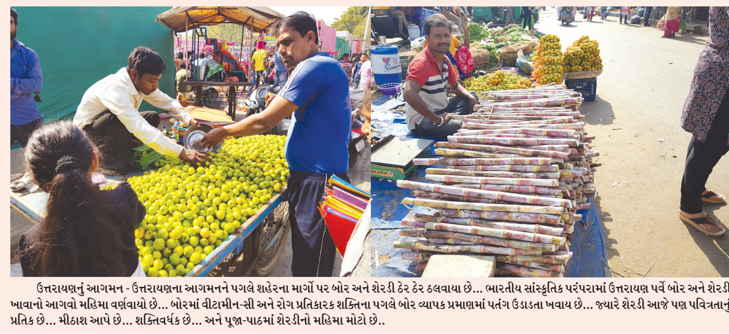
ઉત્તરાયણનું આગમન - ઉત્તરાયણના આગમનને પગલે શહેરના માર્ગો પર બોર અને શેરડી ઠેર ઠેર ઠલવાયા છે... ભારતીય સાંસ્કૃતિક પરંપરામાં ઉત્તરાયણ પર્વ બોર અને શેરડી ખાવાનો આગવો મહિમા વર્ણવાયો છે... બોરમાં વીટામીન-સી અને રોગ પ્રતિકારક શક્તિના પગલે બોર વ્યાપક પ્રમાણમાં પતંગ ઉડાડતા ખવાય છે... જ્યારે શેરડી આજે પણ પવિત્રતાનું પ્રતિક છે... મીઠાશ આપે છે... શક્તિવર્ધક છે... અને પૂજા-પાઠમાં શેરડીનો મહિમા મોટો છે..

ગાંધીનગર, તા. ૧૩ કેન્દ્ર પુરસ્કૃત સાત યોજનાઓના અમલીકરણ અને પડકારોના અભ્યાસ માટે કેન્દ્રની ટીમ આજે જિલ્લાના પ્રવાસે આવી રહી છે. આ ટીમ જિલ્લામાં નેશનલ હેલ્થ મિશન, સર્વ શિક્ષા અભિયાન તેમજ પ્રધાનમંત્રી આવાસ યોજના, સ્વચ્છ ભારત મિશન સહિતની યોજનાઓની સમીક્ષા કરશે. જિલ્લાના પ્રવાસ બાદ આ ટીમ રાજ્યના અન્ય જિલ્લાઓમાં પણ જનાર છે. આ ટીમ જિલ્લાના ત્રણ ગામોમાં મુલાકાત લેશે તેમ તંત્રના અંતરંગ સૂત્રોમાંથી જાણવા મળેલ છે. તંત્ર દ્વારા યોજનાઓના અમલીકરણ અંગેની અત્યાર સુધીની વિગતો અને સિદ્ધિઓ દર્શાવતી ટૂંકી નોંધ પણ પ્રેઝન્ટેશન સાથે તૈયાર કરવામાં આવી હોવાનું આ સૂત્રોએ જણાવ્યું છે.