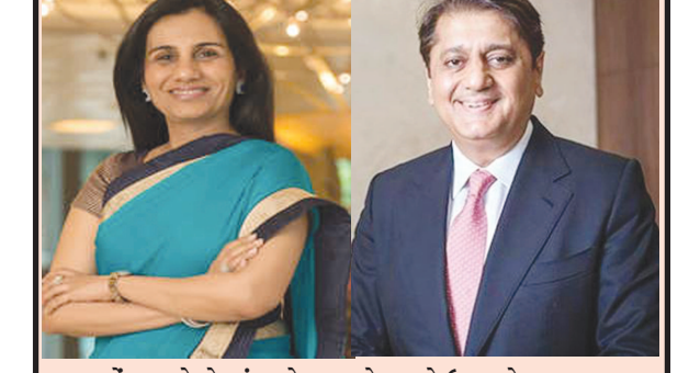
કરવામાં આવ્યો છે. ચંદા કોચર અને અન્યો ઉપર ફોજદાર કાવતરા અને છેતરપિંડી અને ભ્રષ્ટાચાર અટકાવવા ધારાની કલમ હેઠળ તેમના નામ લેવામાં આવ્યા છે. એવો આક્ષેપ કરવામાં આવ્યો છે કે,

નવી દિલ્હી, તા. ૨૪ વિડિયોકોન લોન કેસમાં આઈસીઆઈસીઆઈ બેંકના પૂર્વ વડા ચંદા કોચર, તેમના પતિ દિપક કોચર, વિડિયોકોનના ચેરમેન વેણુગોપાલ ધૂતના નામ સીબીઆઈ દ્વારા તેની એક આઈઆરમાં આપ્યા છે. વિડિયોકોનના વડા સાથે ચંદા કોચરની ડિલિંગના મામલામાં પ્રાથમિક તપાસ પુરી કરી લીધાના ૧૦ મહિના બાદ આ મામલામાં કેસ દાખલ