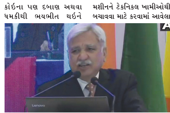
મતપત્રકોના દોરમાં પરત ફરી શકી નહીં. ઈલેક્ટ્રોનિક્સ વોટિંગ

કે, ચૂંટણી પંચ કોઈના પણ દબાણમાં નથી. પંચ દ્વારા ચૂંટણી પ્રક્રિયાને સરળ બનાવવાના વિષય પર આયોજિત એક આંતરરાષ્ટ્રીય કાર્યક્રમમાં વાત કરતા તેમણે કહ્યું હતું કે, ઈવીએમ ઉપર ઉદ્ધવ પ્રશ્નો વચ્ચે કહ્યું હતું કે, અમે રાજકીય પક્ષો સહિત તમામ પક્ષકારો તરફથી ઈવીએમના દરેક પ્રકારના ફિડબેક અને ટિકાને ખુલ્લા મનથી સ્વીકાર કરીએ છીએ. આ મામલામાં અમે દરેક સારી બાબત સિખવા માટે તૈયાર છીએ પરંતુ આની સાથે સાથે અમે