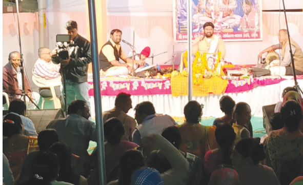
ગાંધીનગરમાં સેક્ટર-૨ દની ગ્રીનસીટી સોસાયટી ખાતે ગુરુવારે રાત્રે સુંદરકાંડનું આયોજન કરવામાં આવ્યું હતું. સુંદરકાંડ પાઠ વક્તા ભારતીબાપુની વાણીમાં યોજાયા હતા. જેનો મોટી સંખ્યામાં શ્રદ્ધાળુ રહીશોએ લાભ લીધો હતો.

આ વિસ્તારમાં સમયાંતરે વનતંત્ર દ્વારા નવા રોપાઓની વાવણી કરવા ઉપરાંત રોપાઓની જાળવણી માટે પણ કામ હાથ ધરવામાં આવે છે. બીજીતરફ શહેરના વન આરક્ષિત વિસ્તારમાં ગંદકી અને દબાણો વધવાની સમસ્યા પણ છેલ્લા કેટલાક સમયથી પ્રબળ બની હતી. જયારે વન આરક્ષિત જગ્યાને અનુલક્ષી નગરના મુખ્ય ઘ અને ચ માર્ગ પર અગાઉ સિમેન્ટના થાંભલાવાળી ફેન્સીંગ કરવામાં આવી હતી તે પણ તુટી જતા અનેક સમસ્યાઓ ઉદભવી હતી. જેને અનુલક્ષીને વનતંત્ર દ્વારા અંદાજિત રૂ ૩ કરોડના ખર્ચે નગરના બન્ને માર્ગો પર