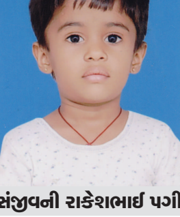
સંજીવની રાકેશભાઈ પગી જન્મદિને વધામણી વિભાગ અંતર્ગત કોઈપણ વાચક પોતાની તસવીરો પ્રકાશન માટે મોકલી શકે છે. પરંતુ, વાચકોને વિનંતી છે કે મોડામાં મોકી આ તસવીરો જન્મદિવસ હોય તેના અગાઉના દિવસે એક વાચક સુધીમાં આપનારને મળી જાય. વાચકો ઈચ્છે તો આ વિભાગમાં પ્રકાશન હેતુ પોતાની તસવીરો અગાઉથી પણ મોકલાવી શકે છે. - સંપાદક