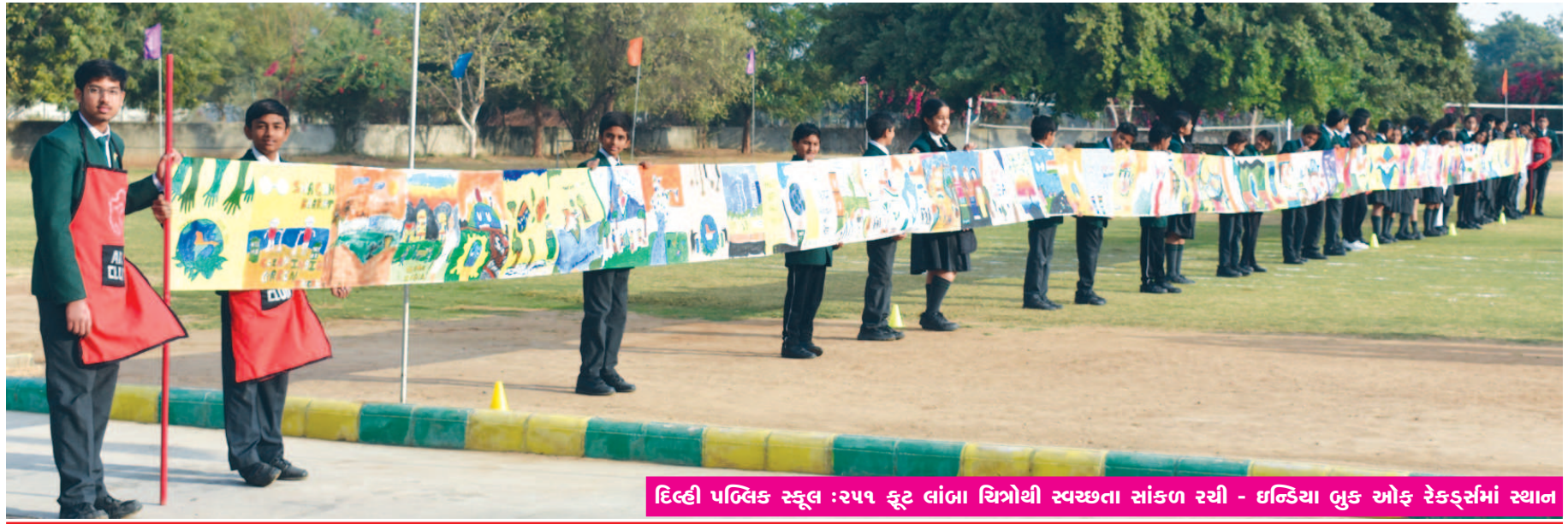
દિલ્હી પબ્લિક સ્કૂલ :૨૫૧ ક્વૉર્ટ લાંબા ચિત્રોથી સ્વચ્છતા સાંકળ રચી - ઇન્ડિયા બુક ઓફ રેકર્ડ્સમાં સ્થાન