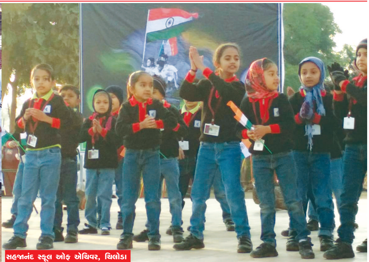
સહજાનંદ સ્કૂલ ઓફ એધિવર, ઘિલોડા