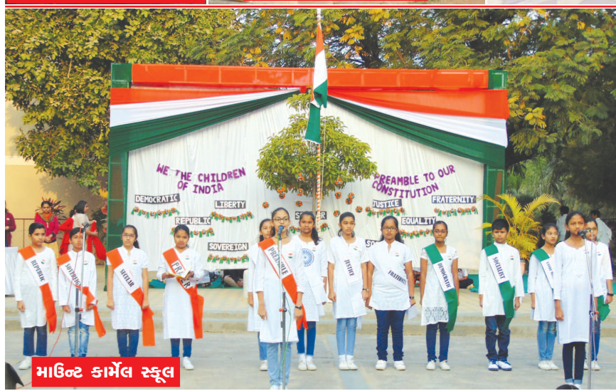
માઉન્ટ કાર્મેલ સ્કૂલ