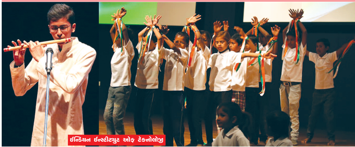
ઈન્ડિયન ઇન્સ્ટીટ્યુટ ઓફ ટેકનોલોજી