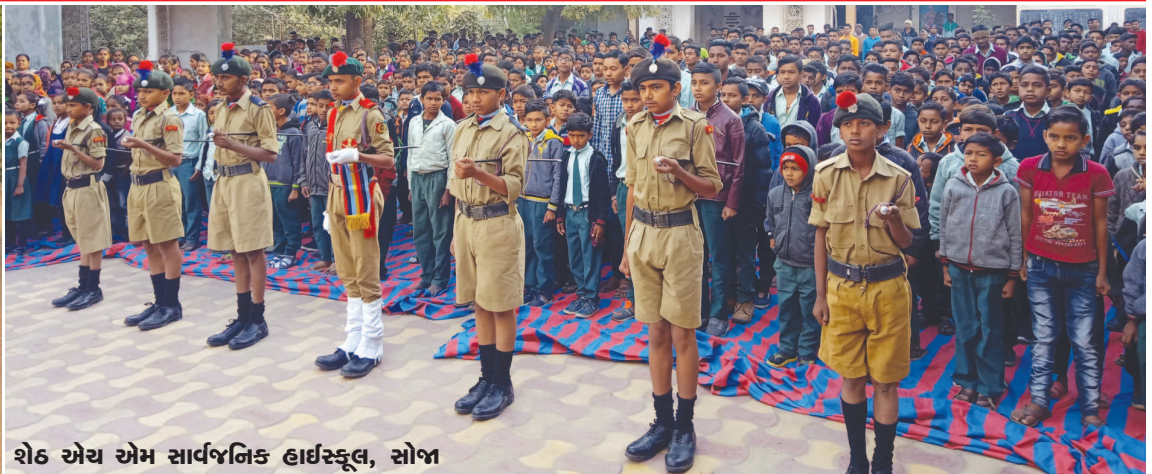
શેઠ એચ એમ સાર્વજનિક હાઈસ્કૂલ, સોજા