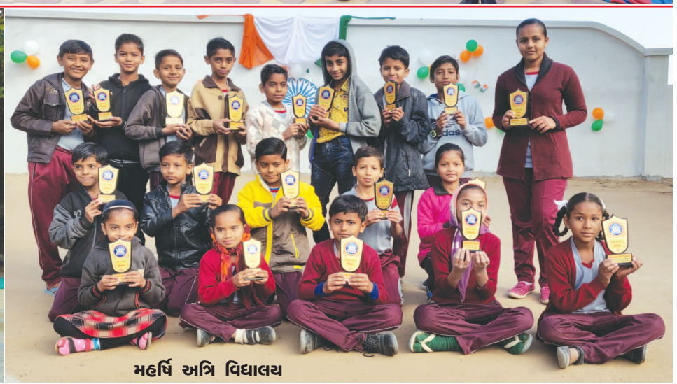
મહર્ષિ અન્નિ વિદ્યાલય