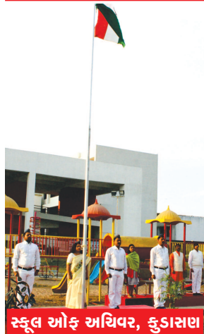
સ્કૂલ ઓફ અધિવર, કુડાસણ