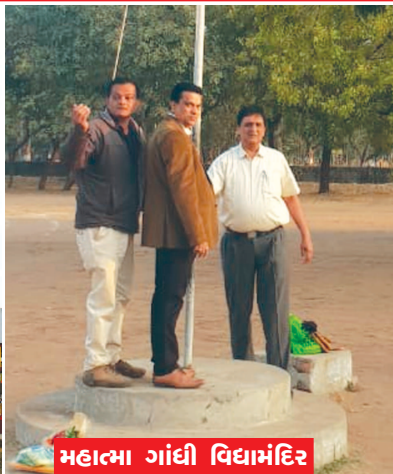
મહાત્મા ગાંધી વિદ્યામંદિર