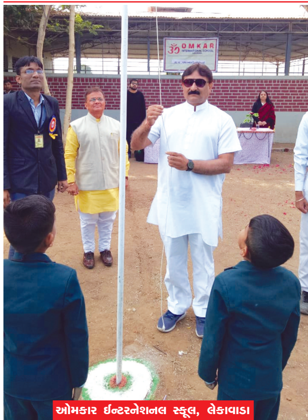
ઓમકાર ઇન્ટરનેશનલ સ્કૂલ, લેકાવાડા