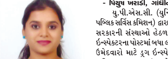
ર.હું હાલ ગવર્નમેન્ટ જોબની તૈયારી કરું છું. તો એના માટે પોતાની જાતે (સેલ્ફ સ્ટડી) કોષ પલા સ્પર્ધાત્મક પરીક્ષાની તૈયારી કરી શકાય?

પણ કરી શકો છો. એમ.ફિલ. એ મોટાભાગે સંશોધન એટલે કે રિસર્ચ પર આધારિત હોય છે. અન્ય એક વિકલ્પ છે આપ કોઈ કંપનીમાં જોબ મેળવી શકો છો. કંપનીમાં જોબ મેળવી શકો છો. એટલે કે આપ એમ.એસ.સી. બાદ પ્રાઈવેટ ક્ષાની જોબ મેળવી શકો છો. એમ.એસ.સી. કર્યા બાદ