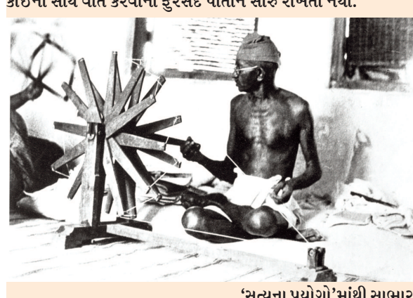
'સત્યના પ્રયોગો' માંથી સાભાર