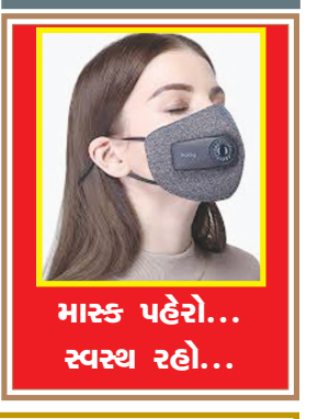
માસ્ક પહેરો... સ્વસ્થ રહો...

જન્મદિને વધામણી વિભાગ અંતર્ગત કોઈપણ વાચક પોતાની તસવીરો પ્રકાશન માટે મોકલી શકે છે. પરંતુ, વાચકોને વિનંતી છે કે મોડામાં મોડી આ તસવીરો જન્મદિવસ હોય તેના અગાઉના દિવસે એક વાગરા સુદીમાં અખબારને મળી જાય. વાચકો ઈચ્છે તો આ વિભાગમાં પ્રકાશન હેલુ પોતાની તસવીરો અગાઉથી પણ મોકલાવી શકે છે.