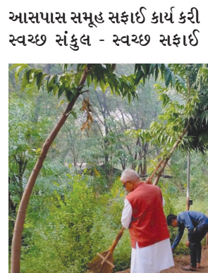
સંકુલના વિવિધ વિભાગો જેવા કે શતાબ્દી બાગ, શતાબ્દી આંબાવાડી, શતાબ્દી ફૂલવાડી, શતાબ્દી ઓષધ બાગ, લીમડા વન, મુખ્ય ચંથાલ, ગાંધી ખાટી ગ્રામઉદ્યોગ, આરોગ્ય કેન્દ્રની

ચિલોડા, તા. ૩ ગુજરાત વિદ્યાપીઠ દ્વારા ઉચ્ચ શિક્ષણનું કામ કરતા ગ્રામસેવા કેન્દ્ર - સાદરાનું નામ મહાદેવ દેસાઈ ગ્રામસેવા સંકુલ રાખવામાં આવ્યું છે, એવા ગાંધીજીના અંગત સચિવ મહાદેવ દેસાઈનો જન્મદિવસ મહાદેવ દેસાઈ ગ્રામસેવા સંકુલ - સાદરાના બીએ, એમએ, વિભાગ દ્વારા સમૂહ સફાઈ કાર્યક્રમ હાથ ધરી ઉજવવામાં આવ્યો હતો.