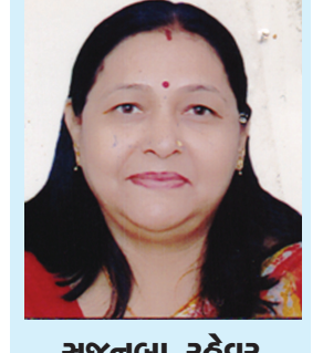
સજનબા રહેવર લાચોનેસ કલબ