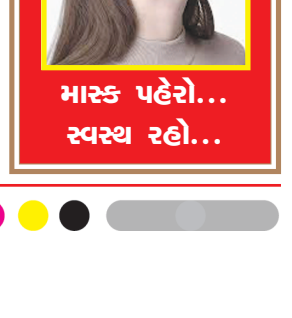
માસ્ક પહેરો... સ્વસ્થ રહો...