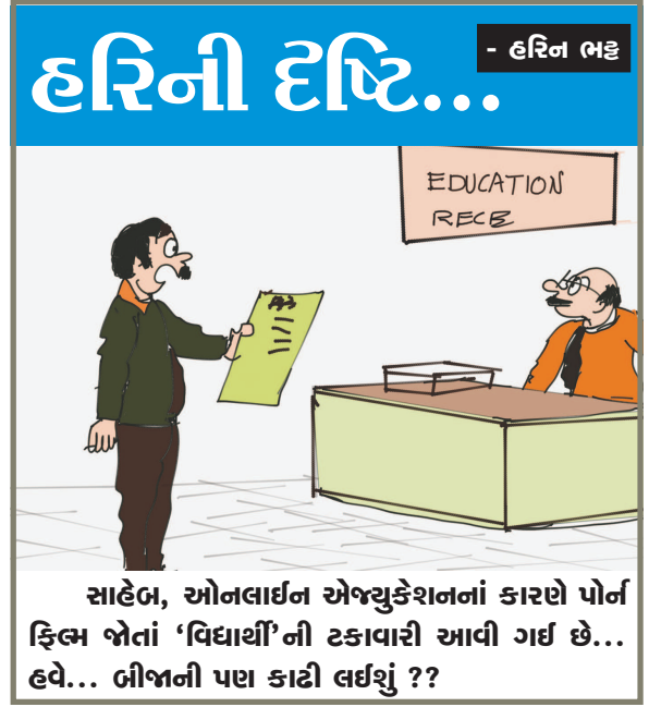
સાહેબ, ઓનલાઈન એજ્યુકેશનમાં કારણે પોર્ન ફિલ્મ જોતાં 'વિદ્યાર્થી'ની ટકાવારી આવી ગઈ છે... હવે... બીજાની પણ કાઢી લઈશું ??