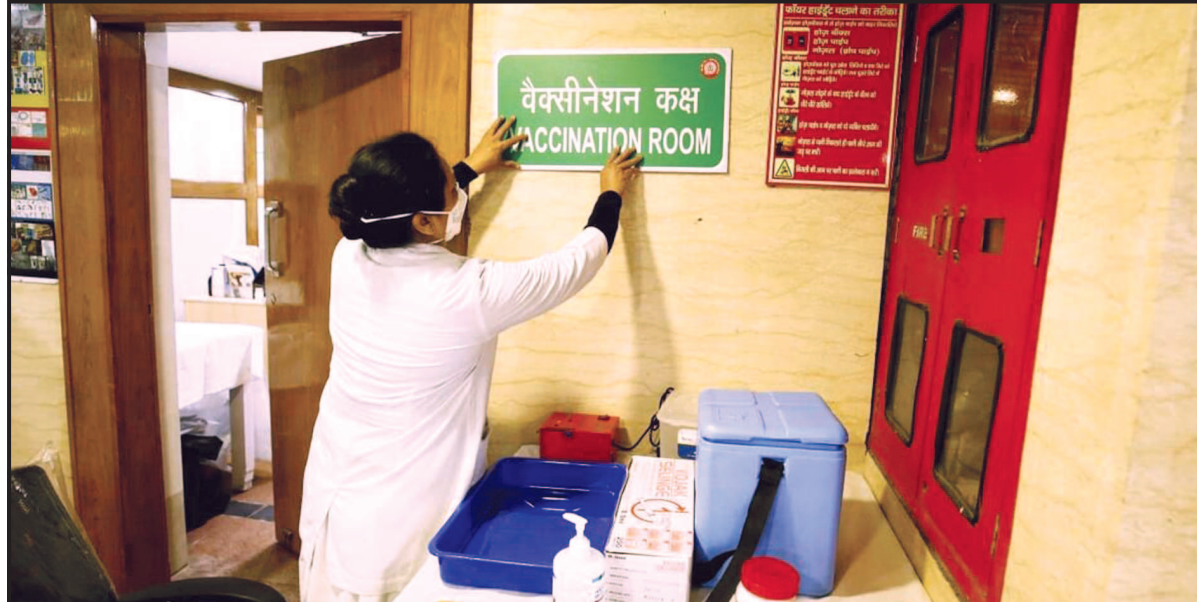
મકરસંક્રાંતિ, માઘ બિહુ જેવા તેહેવારોને ધ્યાનમાં રાખીને આ નિર્ણય લેવાયો છે. આ તમામ તહેવારો ૧૫ જાન્યુઆરીએ પુરા થઈ જશે.

દેશમાં કોરોના વાયરસના રસીકરણની તૈયારીઓ પૂરજોશમાં ચાલી રહી છે. કોરોના વેક્સિનેશન એટલે કે રસીકરણ માટેના ડ્રાય રન ચાલી રહ્યા છે. આ દરમિયાન દેશના વડાપ્રધાન નરેન્દ્ર મોદી તારીખ ૧૧ જાન્યુઆરી એટલે કે સોમવારના દિવસે તમામ રાજ્યોના મુખ્યમંત્રીઓની સાથે વિડીયો કોન્ફરન્સ દ્વારા કોરોનાના રસીકરણની તૈયારીઓના મુદ્દે ચર્ચા કરશે. સુત્રોના જણાવ્યા મુજબ, મીટિંગ બાદ સોમવારે દેશમાં કોરોના વેક્સિનેશનની શરૂઆત માટેની તારીખની જાહેરાત થઈ શકે છે. દેશના મુખ્યમંત્રીઓ સાથે વડાપ્રધાનની બેઠક સોમવારે સાંજે ૪ વાગ્યે શરૂ થઈ શકે છે. શુક્રવારથી વેક્સિનેશન માટે જરૂરી લોજિસ્ટિક્સની તૈયારીઓ પણ શરૂ થઈ ગઈ છે. દેશના તમામ રાજ્યોમાં ડ્રાય રનના ભાગરૂપે કોરોના રસીકરણનો પૂર્વ અભ્યાસ પણ થઈ ચૂક્યો છે. કોરોના વેક્સિનેશનની ડ્રાય રન દરમિયાન અલગ-અલગ રાજ્યોમાંથી જે ફરિયાદો આવી છે તેનો ઉકેલ લાવવામાં આવી રહ્યો છે.