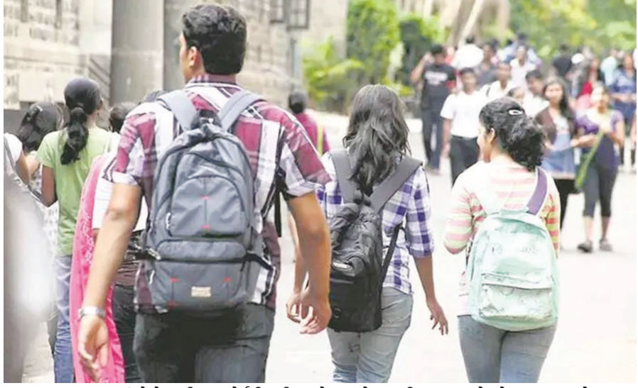
સમગ્ર રાજ્યમાં કોરોનાની બોર્ડની પરીક્ષાઓ પણ લેવાવાની સરકારે ધોરણ ૧૦ અને ૧૨ના ત્રિવ્રતા દિવસને દિવસે ઘટી જાય છે ત્યારે વિદ્યાર્થીઓના લાંબા વિદ્યાર્થીઓ ઉપરાંત કોલેજ કક્ષાએ

ગાંધીનગર,તા. ૧૦ છે ત્યારે આગામી દિવસોમાં ગાળાના શૈક્ષણિક હિતમાં રાજ્ય