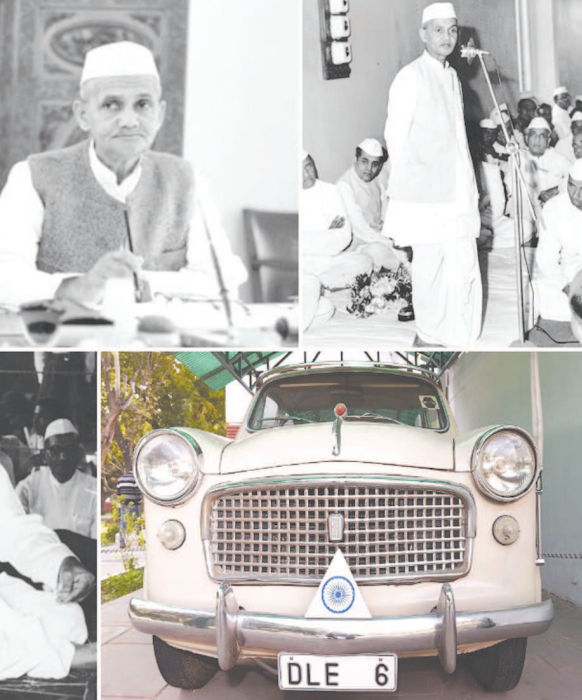
પદભાર ગ્રહણ કર્યો હતો. ભૂખમરામાં સમાહમાં એક ઉપવાસની અપીલ... ૧૯૬૪માં જ્યારે તેઓ વડાપ્રધાન બન્યાં ત્યારે શાસનકાળ દરમિયાન ૧૯૬૫માં ભારત અને પાકિસ્તાન વચ્ચે યુદ્ધ થયું હતું.