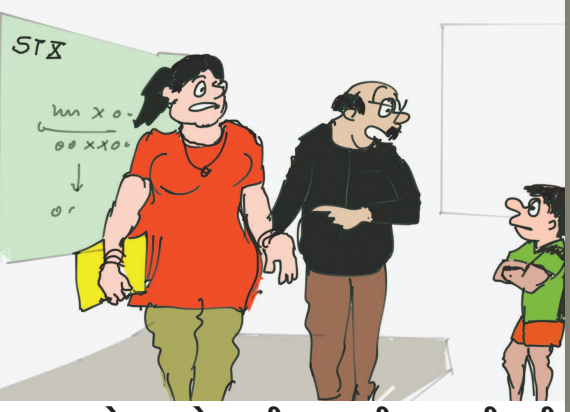
ના બેટા, અમે તમારી ક્લાસ ટીચર બદલી નથી નાખી,... આ તો એ જ છે... લોકડાઉનમાં ઘરે રહ્યા તેમાં...!!