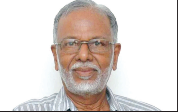
અભૂતપૂર્વ છે. કોવેક્સિન ઈમર્જન્સી સ્ટેજમાં વાપરવાની સંમતિ આપવામાં આવી છે પરંતુ સરકાર માટે આ વેક્સિન ખરીદવી બંધનકર્તા નથી. કોવેક્સિનના વિવાદ અંગે ડોક્ટર જેકબે કહ્યું કે મારો અંગત અભિપ્રાય પૂછવામાં આવે તો હું કોવીશીડને બદલે કોવેક્સિન લેવાનું વધુ પસંદ કરું.

ન્યુ દિલ્હી, તા. ૧૮ જ ગ વિ ધ ય ય ૧ ૧ ૧ ૧ વાઈરોલોજિસ્ટ ડોક્ટર જેકબ જોને કહ્યું હતું કે કોરોના વાઈરસ હવે વધુમાં વધુ બે માસમા નષ્ટ થઈ જશે. વાઈરસના નવા સ્ટ્રેન વિશે બોલતાં તેમણે કહ્યું કે બીજા સ્ટ્રેનના વાઈરસને સમજવા માટે આપણે પહેલા તબક્કાના વાઈરસનો ઊંડો અભ્યાસ કરવો પડશે. જો કે નવા સ્ટ્રેનની વાત સાચી છે એમ તેમણે કહ્યું હતું. વાઈરસનો નવો સ્ટ્રેન આવી ચૂક્યો છે એ તેમણે સ્વીકાર્યું હતું. વેલ્લોરની ક્રિશ્ચન મેડિકલ કોલેજના ભૂતપૂર્વ અધ્યાપક અને ટોચના વાઈરોલોજિસ્ટ ડોક્ટર જેકબે કહ્યું કે કોવેક્સિન બનાવવાની પદ્ધતિ અભૂતપૂર્વ છે પરંતુ એ સાથે આપણે યાદ રાખવું જોઈએ કે અત્યારે સમય પણ