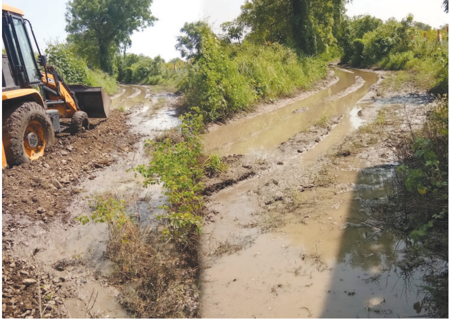
કાર્યવાહી ન થતા ખેડૂતો ન્યાય માંગી રહ્યા છે.

પડે છે. ખેતરમાં જવા માટે એક માત્ર રસ્તા પર ચોમાસામાં કેડ