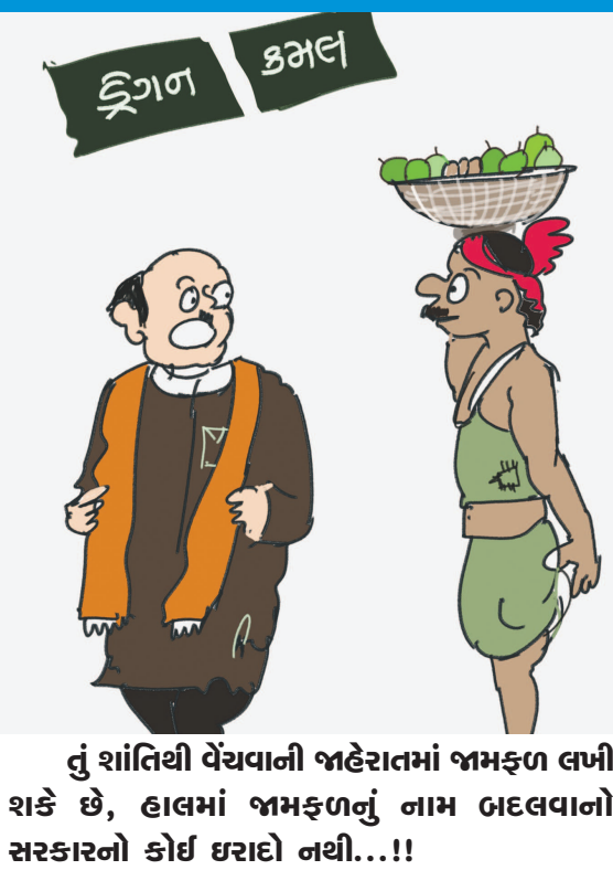
તું શાંતિથી વેંચવાની જાહેરાતમાં જામફળ લખી શકે છે, હાલમાં જામફળનું નામ બદલવાનો સરકારનો કોઈ ઘરાદો નથી...!!