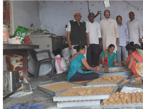
ઈસનપુર મોટા શ્રી કૃત્તાર પરબડી સાર્વજનિક ટ્રસ્ટ દ્વારા શ્યાન માટે ૧૬૦ કિલોના લાડુ બનાવ્યા

બગીચા જેવી સુવિધાઓ મળી છે. પ્રજાની તંદુરસ્તી જાળવવા મોંઘી સારવાર પણ આ હોસ્પિટલમાં તમામ સુવિધાઓ અમારા આરોગ્ય વિભાગ દ્વારા મફત મળવાની છે. જુની બિલ્ડિંગ હતી ત્યારે પણ ૮૫ હજાર કરતા વધારે દર્દીઓ લાભ લેતા હતા. હવે નવું મકાન અને અદ્યતન સુવિધાઓ મળતાં સ્પેશિયલ મળશે. જેથી દર્દીઓને ગાંધીનગર કે, સોલા સીવીલમાં મોકલવા નહીં પડે.