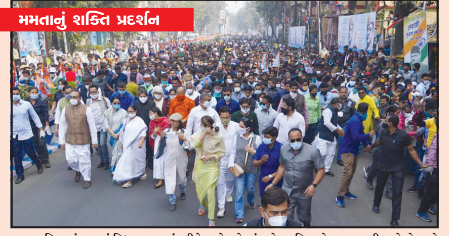
મમતાનું શક્તિ પ્રદર્શન પશ્ચિમ બંગાળમાં વિધાનસભા ચૂંટણીને આડે હવે માંડ એક મહિનાનો સમય બાકી રહ્યો છે ત્યારે તુમલૂલ કોંગ્રેસના સુપ્રીમો અને મુખ્યમંત્રી મમતા બેનરજીએ પદયાત્રા યોજાને પોતાનું શક્તિપ્રદર્શન કર્યું હતું. નેતાજી સુભાષ ચંદ્ર બોઝની ૧૨૫મી જન્મજયંતિ પર સીએમ મમતા બેનરજીએ પદયાત્રા શરૂ કરી અને રેલીનો સંબોધતા પૂર્વ ભાજપ વિરુદ્ધ શંખનાદ પણ ફૂંક્યો હતો. મમતા બેનરજીએ શ્યામ બજારથી રેડ રોડ સુધી પદયાત્રાનું નેતૃત્વ કર્યું હતું. આ સાથે જ તેમણે પશ્ચિમ બંગાળમાં પોતાની પકડ જમાવી રહેલા ભાજપને પોતાની તાકાતનો પણ પરચો આપ્યો હતો.

લોકોની તસવીરો પણ આપવામાં આવી હતી. શૂટરે જણાવ્યું કે તે ૧૯મી જાન્યુઆરીથી સિંધુ બોર્ડર પર છે.