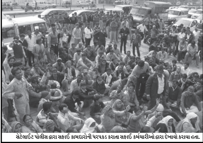
સેટેલાઈટ પોલીસ દ્વારા સફાઈ કામદારોની ધરપકડ કરતા સફાઈ કર્મચારીઓ દ્વારા દેખાવો કરાયા હતા.