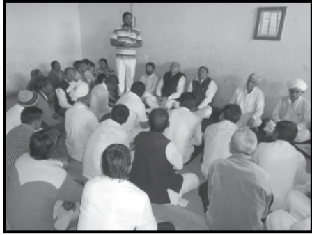
કોંગ્રેસ સમિતિ દ્વારા સદાચાર યાત્રાનું આયોજન કરેલ હોઈ તે નિમિત્તે આ બેઠક મળી હતી.

ડીસા, તા. ૬ ડીસાનાં હિન્દુ ધર્મ શાળા ખાતે ડીસા શહેર તેમજ તાલુકા કોંગ્રેસની બેઠક મળી હતી. જેમાં ગુજરાત પ્રદેશ