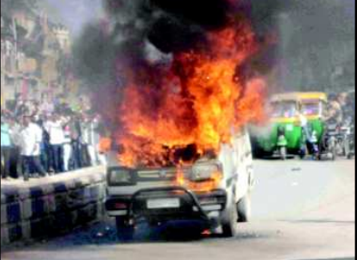
પાલનપુરના સીટીલાઈટ સિનેમા રોડ પર બપોરના સુમારે માટ્ટીવાન ધડાકાભેર સળગી ઉઠતાં ભારે દોડધામ મચી ગઈ હતી. ડ્રાઈવર અને નાનકડી બાળકી સમયસૂકતા વાપરી બહાર ફૂટી પડતાં તેમનો આઘાત બચાવ થયો હતો. ફાયરબ્રિગેડ ઘટના સ્થળે દોડી આચ્છા હતા. જો કે તે પહેલા જ ગાડી બળીને માખ થઈ ગઈ હતી. બનાવની વાત સમગ્ર પાલનપુરમાં વાયુવેગે પ્રસરતા ઘટના સ્થળે લોકોના ટોળેટોળા ભિટી પડ્યા હતા.