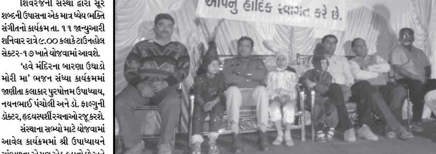
પતંગ-દોરીથી ઘવાતા પક્ષીઓ અને લોકજાગૃતિ કાર્યક્રમ યોજાયો