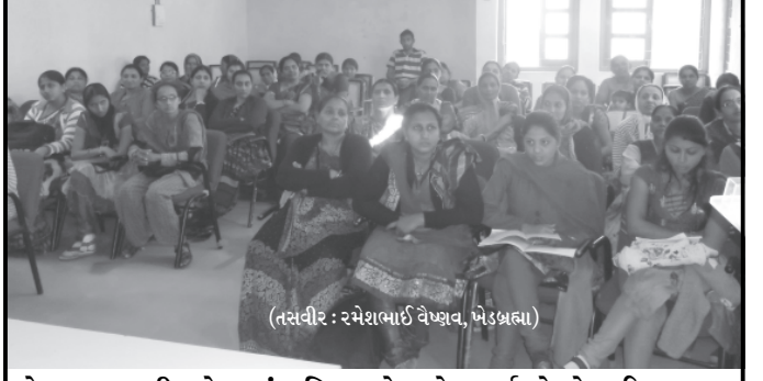
પેડબ્રહ્મા તાલીમ કેન્દ્રમાં મહિલાઓ માટે સ્પર્ધાઓ યોજાઈ

મહાત્મા મંદિર ખાતે યોજનાર રાષ્ટ્રીય શિક્ષણ સમિટના માધ્યમથી દેશના યુવાધનને વૈશ્વિક કક્ષાનું શિક્ષણ ઉપલબ્ધ કરાવે તે ભારતને દુનિયાનું વૈશ્વિક જ્ઞાન કેન્દ્ર બનાવવા માટે એક રોડ મેપ તૈયાર થઈ શકશે. આ સમિટમાં ૧૧ જેટલી એન્કર યુનિવર્સિટીઓ, ૮૫ થી વધુ વક્તાઓ, દેશભરની યુનિવર્સિટીના ૧૦૦થી વધુ કુલપતિ અને નિયામકો સહિત ૧૦૦૦ ન્યાયાપક, ગુજરાતમાં શિક્ષણ મેળવતા ૪૦ લાખથી વધુ વિદેશી વિદ્યાર્થીઓ સહિત રાજ્ય તથા દેશના ૨૦૪ જિલ્લાના ૫૦૦૦ થી વધુ નિતિનિધિઓ ભાગ લેશે.