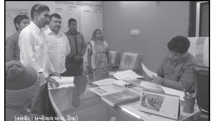
ગુજરાતના ગામડાઓમાં દલિતો પર થતા અત્યાચારોના વિરોધમાં બહુજન સમાજ પાર્ટી દ્વારા ઠેર ઠેર આંદોલન છેડાય છે. જેમાં આભડડાના વિરુદ્ધમાં ૨૬મી જાન્યુઆરી અમદાવાદ ખાતે દલિતો દ્વારા જાહેરમાં વિવિધ કાર્યક્રમ યોજાશે. જે અંગે ડીસાના નાયબ કલેક્ટરને આવેદન પત્ર આપવામાં આવ્યું હતું.

તેમનામાં રહેલી શક્તિઓને ઉજાગર કરવાનું ભગીરથ કાર્ય રાજ્ય સરકાર દ્વારા કરવામાં આવી રહ્યું છે. આ સ્પર્ધામાં ગુજરાત અને રાજ્ય બહારના સાયકલ સવારોએ મોટી સંખ્યામાં જોડાયા હતા. સમગ્ર સ્પર્ધામાં ભાગ લેનાર સાયકલ સવારોને સાયકલ તથા આરોગ્ય વિષયક સુવિધા જિલ્લા વહિવટીતંત્ર દ્વારા પુરી પાડવામાં આવી હતી. ગ્રીન રેસના પ્રસ્થાન સમયે જિલ્લા અગ્રણી શ્રી