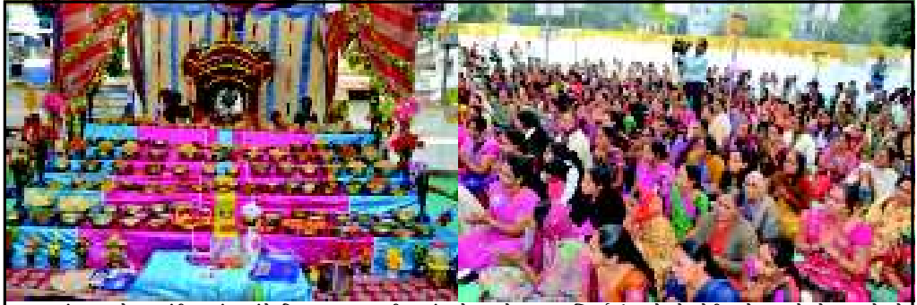
જગદેબા પ્રાગટ્યોલ્સવ - ગાંધીનગરમાં જય અંબે પરિવાર દ્વારા જગત જનની 'મા-અંબા'નો પ્રાગટ્યોલ્સવ ભાવભક્તિપૂર્વક ઉજવાયો હતો. વહેલી સવારે છાપ્પનભોગનો અન્નકૂટ યોજાયો હતો. ભક્તિવંદનાની સાથે સાથે નિઃશુલ્ક દંત ચિકિત્સા યથ જૈવા સામાજિક સેવાનો પ્રકલ્પ યોજાયો હતો. પોષ સુદ પુનમના પાવન પર્વ સમગ્ર દિવસ મા-આદ્યક્તિની ઉપાસનામાં ભાવિકો લિખતાયો હતો.

ગાંધીનગર, તા. ૧૬ શહેરના જૂના સેક્ટરોમાં આંતરિક માર્ગોને ચકાસક બનાવવા ટુંકમાં કામ શરૂ થશે. સે. ૨૦ થી ૩૦ના આંતરિક માર્ગોના નવીનીકરણ પાછળ રૂ. ૧૪ કરોડનો ખર્ચ થશે. સેક્ટરોના આંતરિક માર્ગોનું કામ હાથ ધરવા ટેન્ડર પ્રક્રિયા પૂર્ણ થઈ ગઈ છે. ટુંકમાં જ વર્ક ઓર્ડર આપી દેવાશે. શહેરમાં માર્ગ નવીનીકરણ અન્વયે બાકીના કામો તબક્કાવાર હાથ ધરાશે. થોડા સમય અગાઉ શહેરનું રોડ નેટવર્ક સુધારણા ૩૭ કરોડના ખર્ચને મંજૂરી આપવામાં આવી હતી. જેમાં 'ક' અને 'ગ' માર્ગ ઉપરોત્તર સે. ૨૦થી ૩૦ના આંતરિક માર્ગોનું પણ નવીનીકરણ હાથ ધરવાનું આયોજન કરવામાં આવ્યું છે. ગત ચોમાસા પૂર્વે નવવિકસિત સેક્ટરોના આંતરિક રસ્તાઓનું નવીનીકરણ કરવામાં આવ્યું હતું. જ્યારે લાંબા સમયથી જૂના સેક્ટરોના આંતરિક માર્ગોને લીસા બનાવવાની પણ પ્રબળ માંગ ઉઠવા પામી હતી. ચાર વર્ષથી વધુ લાંબા સમયગાળાના અંતે જૂના સેક્ટરોના આંતરિક માર્ગો ઉપડ-ખાબડ બનવાની સાથે ગાબડા અસ્તિત્વમાં આવ્યા છે. ગત ચોમાસામાં પણ માર્ગોનું ધોવાણ દેવાશે.